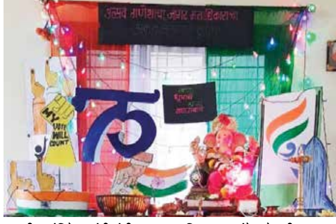
पाली : अंबिके कुटुंबीयांची मतदान अधिकारचा संदेश देणारी आरास.