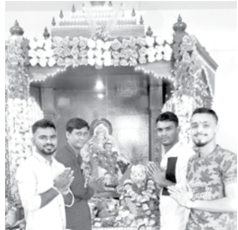
रोहिंजणचा राजा, रोहिंजण, पनवेल