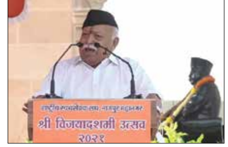
काय पाहायचे, काय नाही याचे काहीच नियंत्रण नाही. ओटीटी प्लॅटफॉर्मवर काय दाखवायचे यावरही नियंत्रण नाही.

मोहन भागवत म्हणाले, तंत्रज्ञानाच्या आधारावर नवनव्या गोष्टी येत आहेत. या गोष्टी आगीत तेल ओतण्याचे काम करत आहेत. ओटीटी प्लॅटफॉर्मवर नियंत्रण नाही. तेथे कशाप्रकारचे चित्रपट येतात, काय काय येते? आता कोरोना काळात तर लहान मुलांच्या हातातसुद्धा मोबाइल आलाय. ऑनलाइन