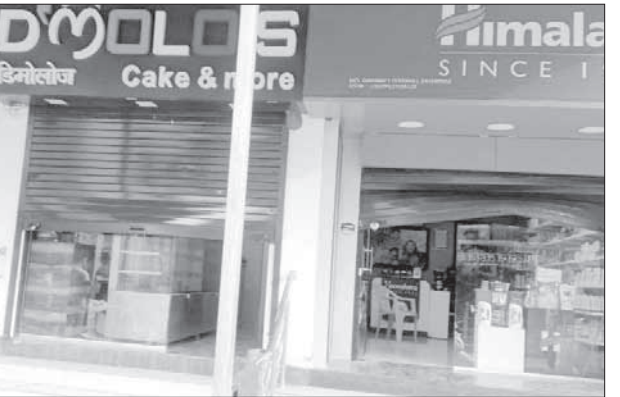
स्टोअर्समधील पाच हजार ४३५ रुपये, कॉंबडपाडा येथील जय आईस्क्रीम पार्लर मधील एक मोबाईल व सात हजार असे एकूण १३ हजार रुपयाचा ऐवज, स्वरा कलेक्शनमधील एक हजार रुपये असे एकूण सुमारे ४३ हजार ९००

पेण : प्रतिनिधी अज्ञात चोरट्यांनी एकाच रात्री पेणमधील आठ दुकाने फोडून पोलिसांना आवाहन दिले आहे. मात्र दुकानदारांच्या हुशारीमुळे या चोरीमध्ये चोरट्यांच्या हाती फारसे काही लागले नाही. रविवारी (दि. १२) रात्री अज्ञात चोरट्यांनी पेणमधील आठ दुकाने फोडली. त्यापैकी गांधी मंदिर येथील डिमोलोज केक शाॅपमधील १० हजार रुपये, साईराज स्वीट अँड फरसाणमधील ८०० रुपये, गावंड गोडवील इंटर प्रायझेसमधील ११०० रुपये, उत्कर्षनगर येथील रिंग रोड जनरल स्टोअर्समधील ११ हजार ५०० रुपये, चिंतामण जनरल स्टोअर्स एक हजार रुपये, पेण नाक्यावरील जलाराम मेडिकल