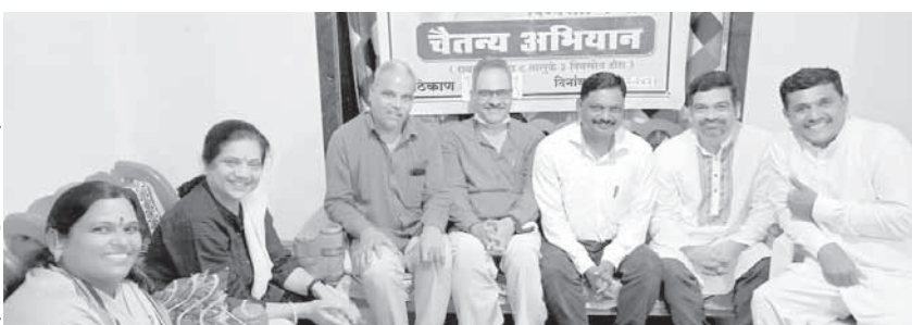
सर्वच ठिकाणी ऑफलाइन नियमित पाठपुरावा सुरु करून मकरसंक्रांत स्पेशल मेघा हॅप्पीनेस, १४ ऑनलाइन हॅप्पीनेस शिबिरांचे आयोजन करण्यात आले आहे. यामध्ये रायगड जिल्ह्यातील