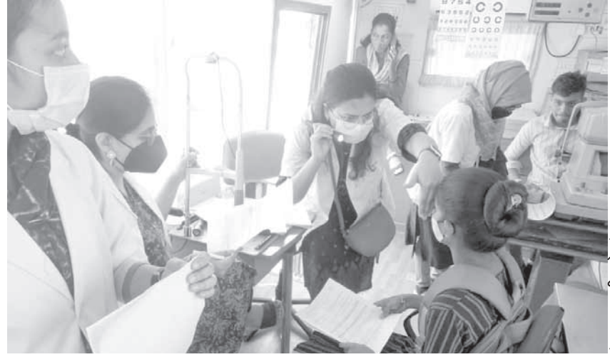
माणगाव येथील शिबिरात ४८ मुलांची नेत्रतपासणी करण्यात आली.