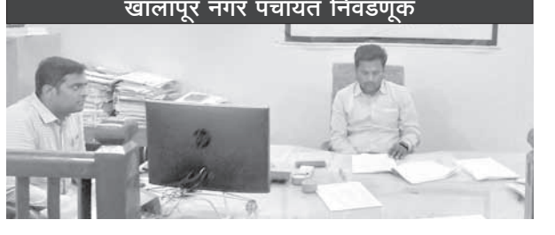
खालापूर नगरपंचायतीच्या निवडणूक होणार आहे. भाजप, मनसे आणि शेकाप स्वबळावर निवडणूक रिंगणात उतरणार असल्याने निवडणुकीची रंगत वाढणार आहे.

खोपोली, खालापूर : प्रतिनिधी खालापूर नगरपंचायतीची सार्वत्रिक निवडणूक २३ डिसेंबर रोजी होत असून, सदस्यपदासाठी एकूण ६८ उमेदवारी अर्ज दाखल झाले होते. सोमवारी (दि.१३) अर्ज मागे घेण्याची मुदत संपल्यापुर्वी २३ उमेदवारी अर्ज मागे घेण्यात आले. त्यामुळे आता सदस्यपदाच्या १६ जागांसाठी ४५ उमेदवारी अर्ज शिल्लक राहिले आहेत.