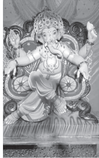
मधुकर गावंड, आवरे, उरण