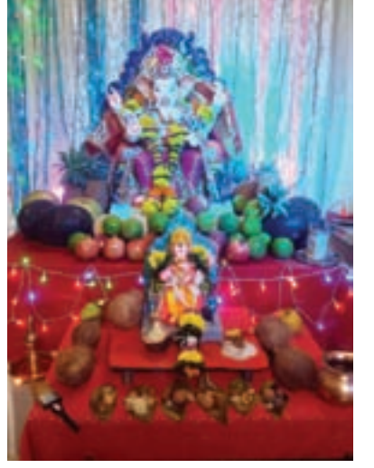
पनवेल तालुका पोलीस ठाणे