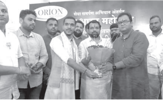
पनवेल : रामप्रहार वृत्त