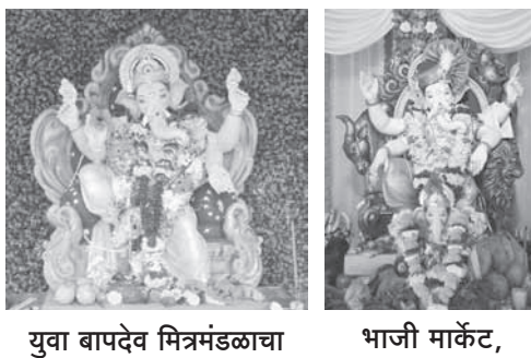
युवा बापदेव मित्रमंडळाचा कुरुळचा राजा, अलिबाग