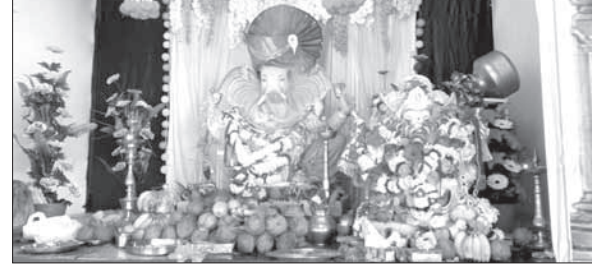
सिद्धेश्वर युवा मंडळ, दिघोडे, उरण