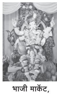
भाजी मार्केट, अलिबाग