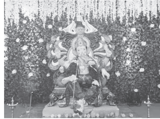
पोलीस लाईन बॉईजचा राजा, अलिबाग