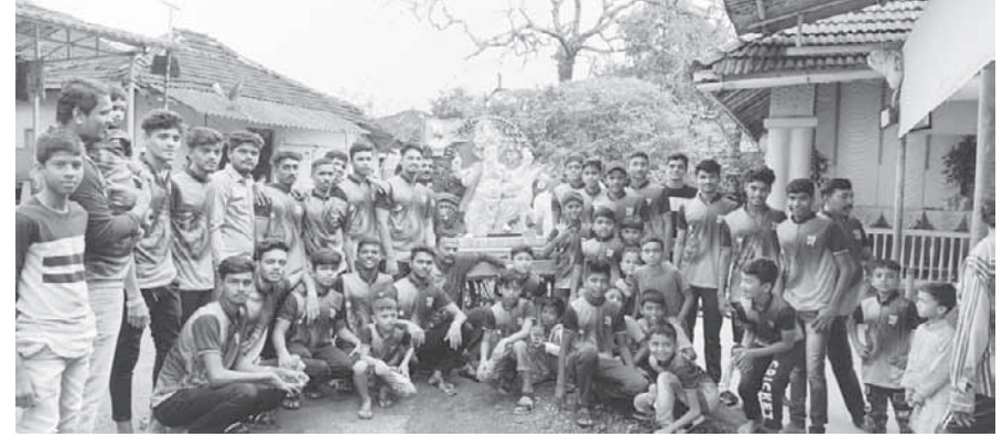
पेण : अहविनायक मित्र मंडळ धूळवड झोतीरपाडा यांच्या वतीने साखरचौध गणपती प्रतिष्ठापना करण्यात आली असून तेथे दर्शन घेताना मंडळाचे पदाधिकारी व ग्रामस्थ.