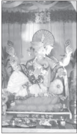
मोठेघरचा राजा, जिते, पेण