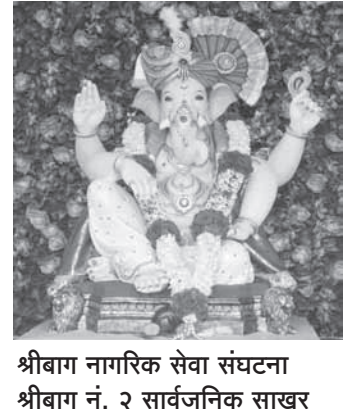
श्रीबाग नागरिक सेवा संघटना श्रीबाग नं. २ सार्वजनिक साखर चौध गणेशोत्सव, अलिबाग