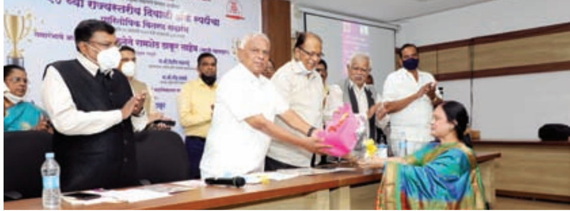
अधिकृत छायाचित्र पान ६ वर.