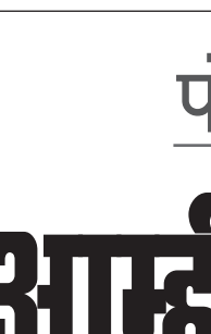
पनवेल : रामप्रहर वृत्त