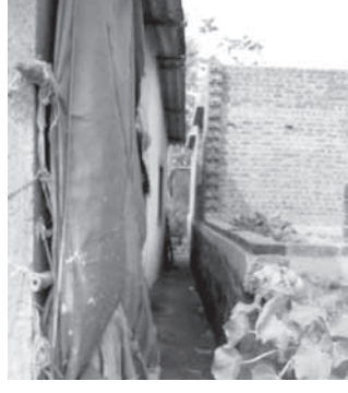
होत आहे. याबाबत गेल्या १८ ऑक्टोबर २०२१पासून आपण

या प्रकरणी गटविकास अधिकारी व विहूर ग्रामसेवकांकडे वेळोवेळी तक्रारी करूनही प्रशासन शेजाऱ्यांनी बांधकाम सुरु ठेवले असून त्यामुळे आपल्यावर अन्याय