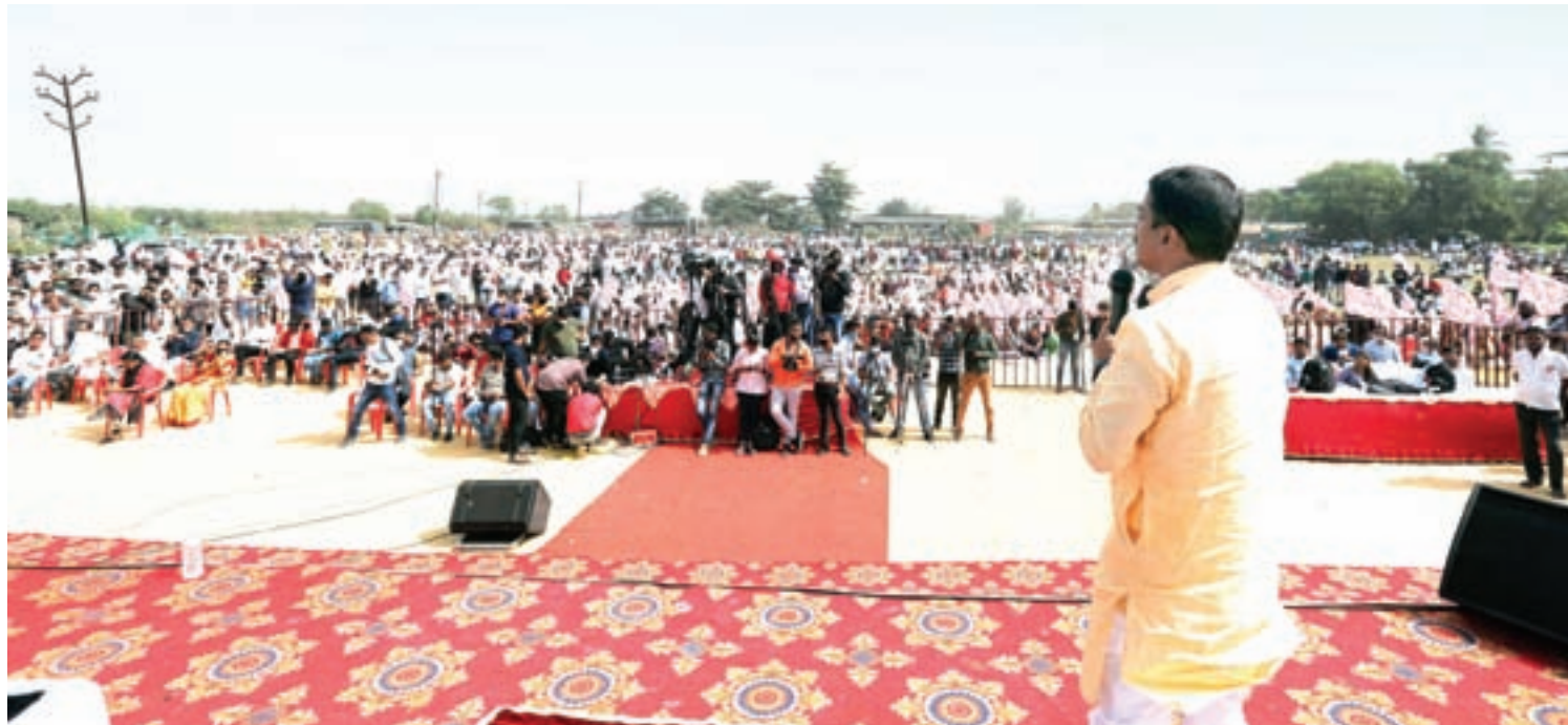
अधिक छायाचित्रे पान ६ वर.