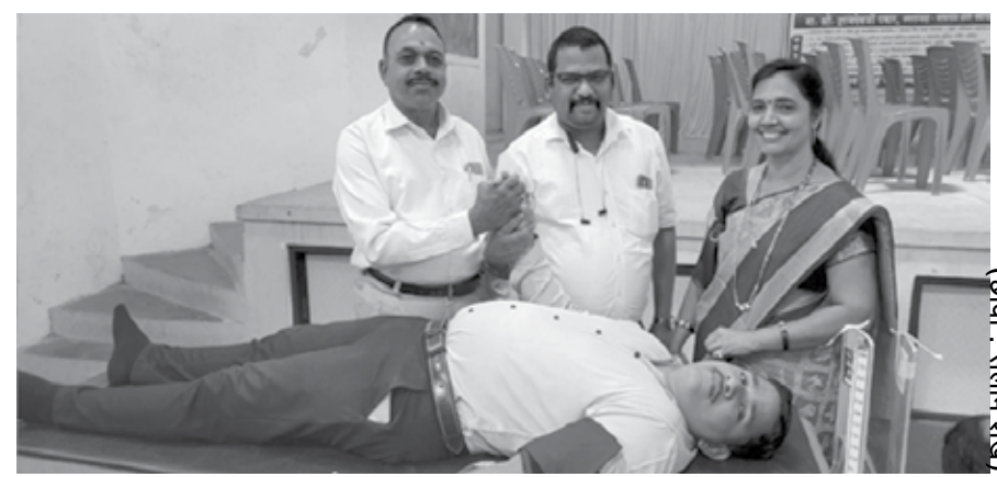
(छाया : रवींद्र शेंकर)

बोअरवेल, मस्जिद मोहल्ला, शिवम कॉम्प्युटर सेंटर, युवा क्रिकेट क्लब, एकता ग्रामीण टेनिस क्रिकेट असोसिएशन, श्री. शिवछत्रपती ग्रामीण टेनिस क्रिकेट असोसिएशन तसेच