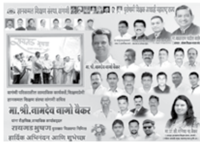
जडणघडणीत मोठे योगदान असलेल्या ठराविक व्यक्तींना 'रायगड भूषण' ने सन्मानित

२५७ पुरस्कारांची खैरात वाटणाऱ्या जिल्हा परिषदेचा प्रताप