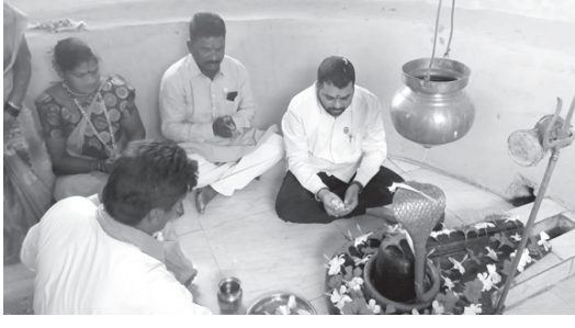
पनवेलच्या बेलपाडा येथे मंदिराचे कलशपूजन