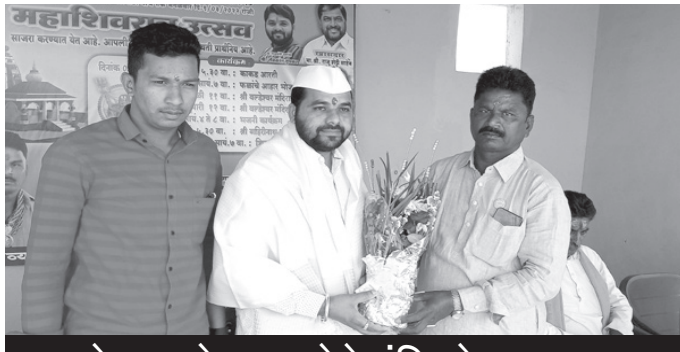
पनवेलच्या बेलपाडा येथे मंदिराचे कलशपूजन

ग्रामीण भाग उध्वस्त झालाय. सामान्य माणसाला जगणे कठीण झाले आहे. व्यापारी उद्योजक कोरोनाच्या काळात अडवणीत आहेत. या सर्व प्रश्नांवर सत्ताधऱ्यांमध्ये कुठेच चर्चा होताना दिसत नाही.