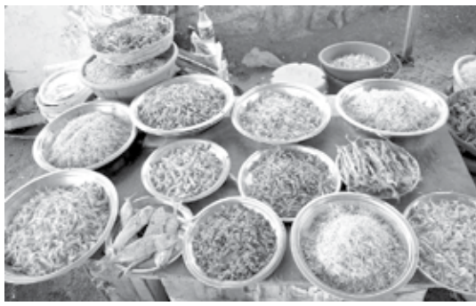
(छाया : धम्मशील सावंत)

याबरोबरच अनेक घरांच्या अंगणात, पडवीत, छतावर, कौलावर किंवा पत्र्यावर कापलेल्या आंब्याच्या फोडी आंबोशी करण्यासाठी ठेवल्या जातात. त्याचबरोबर सुकी मच्छी तसेच कोकम सरबत बनविण्यासाठी बाटल्यांमध्ये कोकम ठेवले जाते. मसाल्यासाठी मिरची येथेच सुकविल्या जातात. पापड, सांडगी, कुरडया, चिकोड्या आदी घरीच बनविले व वाळविले जातात. अशी ही पावसाळ्याची बेगमी व वाळवण संस्कृती अखंडितपणे सुरु आहे.