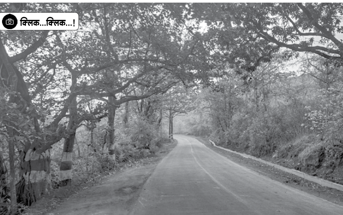
म्हसळा-गोरेगाव मार्गावरील सूर्योदयाच्या सुमारास दिसणारे विलोभनीय दृश्य.