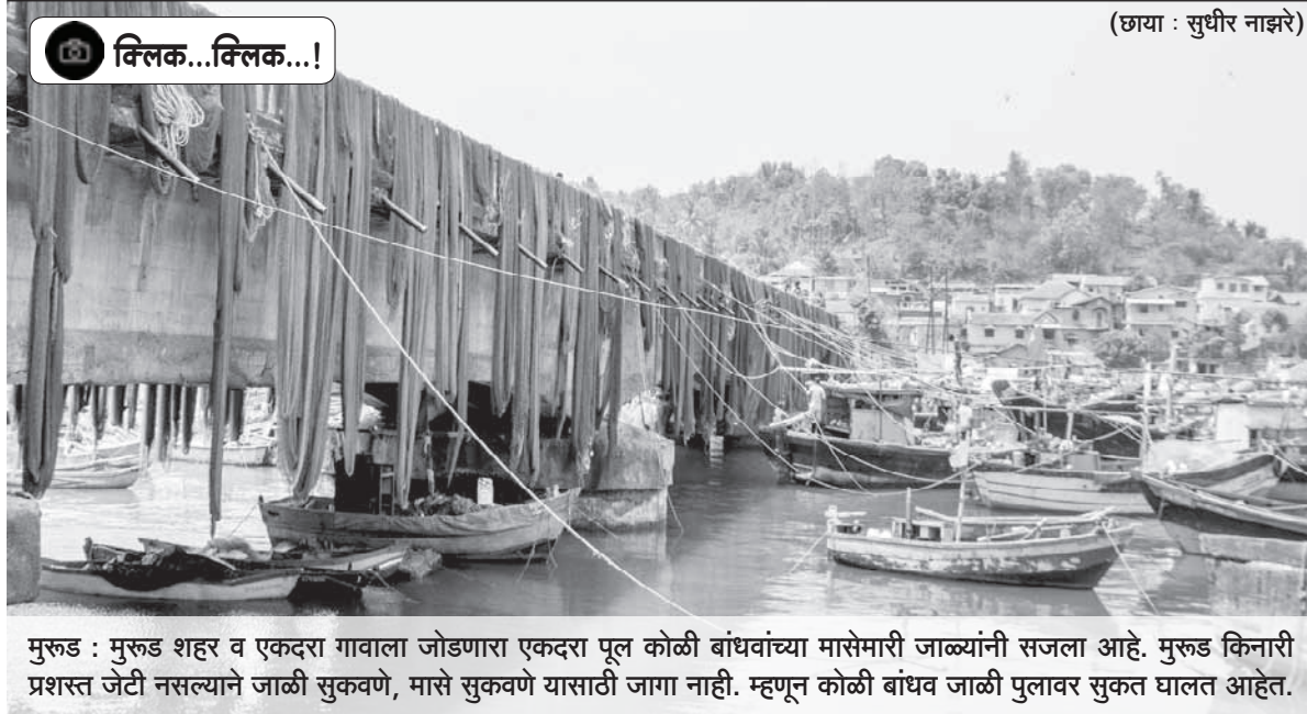
मुळुड : मुळुड शहर व एकदरा गावाला जोडणारा एकदरा पूल कोळी बांधवांच्या मासेमारी जाळ्यांनी सजला आहे. मुळुड किनारी प्रशस्त जेटी नसल्याने जाळी सुकवणे, मासे सुकवणे यासाठी जागा नाही. म्हणून कोळी बांधव जाळी पुलावर सुकत घालत आहेत.