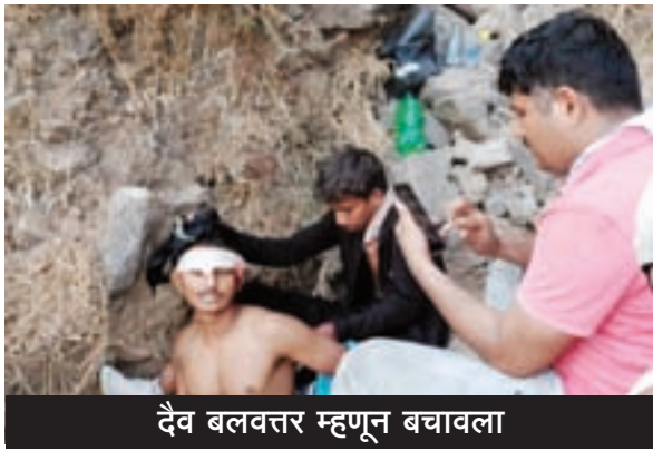
दैव बलवत्तर म्हणून बचावला