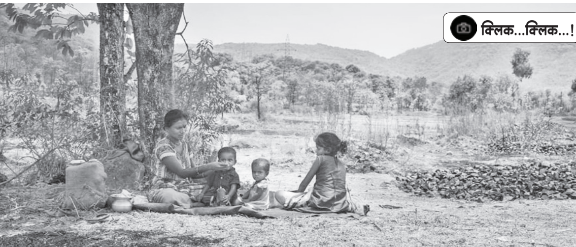
महाड : दुपारच्या तळपत्या उन्हात आपले काम आटपून माऊली आपल्या लेकरांना आनंदाने घास भरवतानाचा क्षण टीपला आहे प्रितम सकपाळ यांनी.