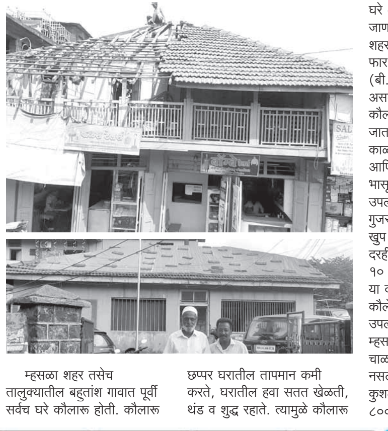
म्हसळा शहर तसेच तालुक्यातील बहुतांश गावात पूर्वी सर्वच घरे कौलारू होती. कौलारू छप्पर घरातील तापमान कमी करते, घरातील हवा सतत खेळती, थंड व शुद्ध रहाते. त्यामुळे कौलारू

कौलारू घरांवरील कौलांची दरवर्षी एप्रिल-मे महिन्यांमध्ये स्वच्छता व डागडुजी केली जाते. त्यावेळी वर्षभरात फुटलेली, सरकलेली कौले आणि कोने नीट केले जातात, त्याला घर चाळणे किंवा शिवणे असे म्हणतात. मात्र कौले चाळणाऱ्या कुशल मजुरांची कमतरता भासत असल्याने म्हसळ्यातील ७० टक्के घरे या वर्षी चाळली गेली नाहीत. सुमारे ३० वर्षापूर्वी म्हसळा शहर हे निसर्गाच्या कुशीतील कौलारू घरांचे गाव होते. मात्र आता म्हसळा शहरात सुमारे २० ते ३० गृहनिर्माण प्रकल्प, सुमारे ३००० ते ४००० आरसीसी घरे उभी राहिली आहेत. तसेच उर्वरीत घरांवर सिमेंट आणि पत्रांचे छप्पर दिसत असल्याचे चित्र आहे. तरीही जुन्या पद्धतीची कौलारू घरे अजूनही मोठ्या संख्येने आहेत. निसर्ग आणि तोटे वादळानंतर कौलारू घरांचे प्रमाण कमी होत गेले.