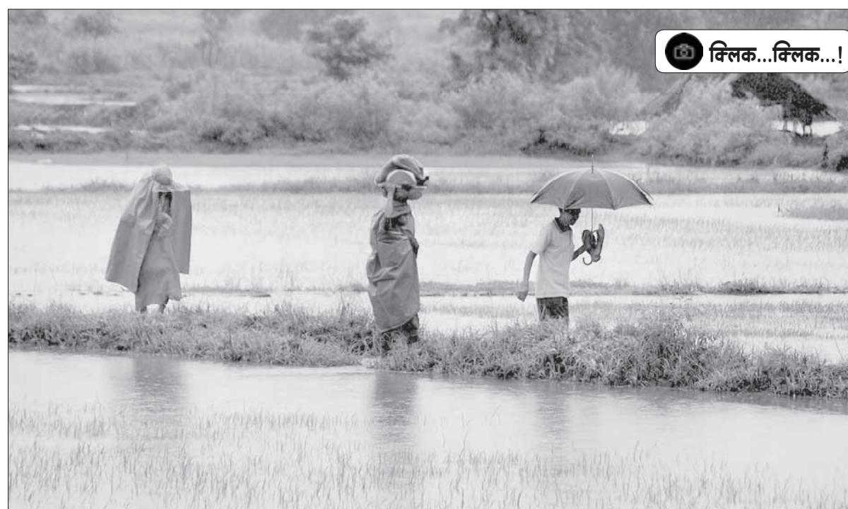
मुरुड : मुरुड व खारआंबोली परिसरात पावसामुळे शेतकरी सुखावला आहे. या परिसरात शेतीकामांना वेग आला आहे.

प्रतिकांतून रूपकात्मक, गूढ, आध्यात्मिक भाव सूचित केले जातात. त्या दृष्टीने चित्रांची शिर्षकेही अन्वर्थक वाटतात. त्यांच्या चित्रांमध्ये साधलेल्या रंग व आकार यांच्या सुसंवादी मेळातून अपूर्व सौंदर्य प्रतीत होते. व्यक्तिचित्रे रंगविण्यातही त्यांनी असामान्य प्राविण्य मिळविले. सुरुवातीच्या काळात त्यांनी विपुल व्यक्तिचित्रे रंगविली. बॉबी, रीटा, दादाजी, गे हेम्स, विजु ही त्यांनी रंगविलेली काही उत्कृष्ट व्यक्तिचित्रे आहेत. चेहऱ्यावरील भावदर्शनातून व्यक्तिमत्त्वाचा शोध घेणे, ही त्यांच्या व्यक्तिचित्रांमागील प्रेरणा होती. तैलरंगाप्रमाणेच जलरंग माध्यमावरही त्यांचे विलक्षण प्रभुत्व होते. मुंबईतील अनेकविध स्थळांची शेकडो चित्रे अपारदर्शक रंगांत रंगवून त्यांनी मुंबईचे आगळेवेगळे रंगमय सचित्र दर्शन घडवले. छटायुक्त कागदाच्या नैसर्गिक छटेचा कौशल्यपूर्ण वापर, रंगांचे द्रुत फटकारे, रंग व छाया-प्रकाशाचे मनोहारी दर्शन इ. वैशिष्ट्यांमुळे ही चित्रे लक्षणीय ठरली आहेत. भित्तिचित्रण व भित्तिलेपचित्रण तंत्रांचाही त्यांचा गाढा, सखोल व्यासंग होता. खडकवासल्याच्या राष्ट्रीय संरक्षण प्रबोधिनीतील व एस. के. एफ. फॅक्टरीतील भित्तिचित्रे हे मोठे प्रकल्प त्यांनी सांघिक पद्धतीने पूर्ण केले. मुंबई दूरदर्शनवरून त्यांनी अनेक कलाविषयक कार्यक्रम सादर केले. -श्री. डे. इनमदार