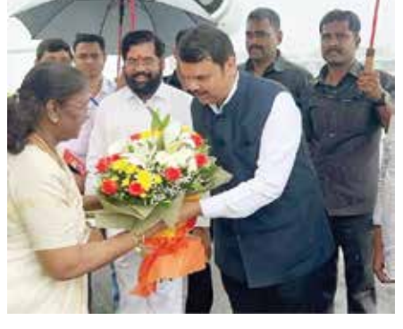
लोढा, आमदार आशिष शेलार व आमदार भारत गोगावले उपस्थित होते. शिवसेनेसह एनडीएचे घटकपक्ष, सहयोगी पक्ष व अपक्ष आमदार बैठकीस उपस्थित होते. महाराष्ट्राच्या पवित्र भूमीला माझा नमस्कार, अशी मराठीतून सुरुवात करून (पान २ वर...)

मुंबई : प्रतिनिधी राष्ट्रपतीपदाच्या निवडणुकीत राष्ट्रीय लोकशाही आघाडीच्या (एनडीए) उमेदवार द्रौपदी मुर्मू यांना महाराष्ट्रातून एनडीएच्या मतांपेक्षाही अधिक मते मिळतील व विक्रमी मताधिक्य मिळेल, असा विश्वास गुरुवारी (दि. १४) मुंबईत एनडीएच्या ज्येष्ठ नेत्यांनी व्यक्त केला. राष्ट्रपतीपदाच्या निवडणुकीसाठी मतदार असलेल्या खासदार व आमदारांशी संवाद साधण्यासाठी मुर्मू आल्या होत्या. या वेळी व्यासपीठावर केंद्रीय मंत्री नितिन गडकरी, केंद्रीय मंत्री पीयूष गोयल, केंद्रीय मंत्री नारायण राणे, केंद्रीय राज्यमंत्री रामदास आठवले, मुख्यमंत्री एकनाथ शिंदे, उपमुख्यमंत्री देवेंद्र फडणवीस, भाजपचे प्रदेशाध्यक्ष चंद्रकांत पाटील, डॉ. भारती पवार, भाजप राष्ट्रीय सरचिटणीस विनोद तावडे व सी. टी. रवी, मुंबई भाजप अध्यक्ष मंगलप्रभात