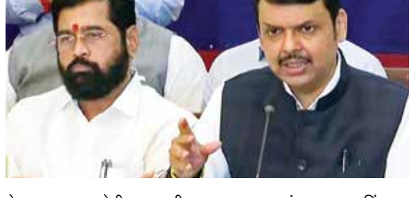
येणार असल्याचेही फडणवीस यांनी नमूद केले. ग्रामपंचायत किंवा नगरपालिकेच्या निवडणुकीत

बैठकीत म्हणाले, देशातील सर्वच राज्यात सरपंचाची थेट जनतेतून निवड होते. त्यामुळे महाराष्ट्र सरपंच परिषदेतही राज्यातील ५० हजारांहून अधिक सरपंचांनी एकमुखाने सरपंचाची निवड थेट जनतेतून व्हावी, असे म्हटले आहे. त्यानुसारच हा निर्णय घेण्यात आला आहे. यासाठी महाराष्ट्र ग्रामपंचायत अधिनियम १९५८च्या संबंधित कलमांमध्ये सुधारणा करण्यात