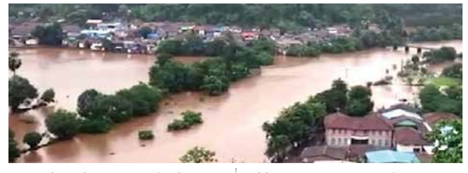
पेणमध्ये घरांच्या भिंती कोसळल्या पेण शहरातील एसटी स्थानक, कोळीवाडा, चिंचपाडा, विठ्ठलवाडी, कारमेल स्कूल, महाडिकवाडी, पामबीच रोडसह तालुक्यातील अंतोरे, खरोशी, तांबडशेत आदी गावांमध्ये पाणी शिरले असून अनेक ठिकाणी घरांच्या भिंती कोसळून नुकसान झाले आहे. कोरे मार्गावर आला मातीचा भराव कोकण रेल्वेमार्गावर मातीचा भराव आल्याने मुंबई-मडगाव-मांडवी एक्सप्रेस खोळंबली होती. त्यामुळे खेड रेल्वेस्थानकावर पुढील सूचना मिळेपर्यंत तिकीट विक्री थांबविण्यात आली. यामुळे मोठ्या संख्येने नागरिकांची गैरसोय झाली.

रायगडातील नद्यांनी ओलांडली धोक्याची पातळी अलिबाग : रामप्रहर वृत्त राज्यात पावसाचा जोर कायम असून अनेक ठिकाणी पूरस्थिती निर्माण झाली आहे. कोकण, मध्य महाराष्ट्र सर्वदूर कमी-अधिक प्रमाणात पाऊस होत असून, या विभागात आणखी दोन दिवस मुसळधारची शक्यता वर्तविण्यात आली आहे. पालघर, रायगड, नाशिक, पुणे, सातारा, कोल्हापुरात रेड अलर्ट जारी करण्यात आला आहे. रायगडातील महाड तालुक्यातील सावित्री नदीने धोक्याची पातळी ओलांडल्याने बुधवारी नदीचे पाणी आले होते. (पान २ वर...)