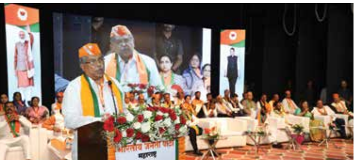
सत्रात ते बोलत होते. या वेळी प्रदेशाध्यक्ष पाटील यांनी उपमुख्यमंत्री फडणवीस

पनवेल : उपमुख्यमंत्री देवेंद्र फडणवीस यांनी भारतीय जनता पक्षाच्या कार्यकर्त्यांसमोर त्याग आणि शिस्तीचा आदर्श निर्माण केला आहे. पक्षाच्या आदेशानुसार काम करण्याच्या आपल्या सामर्थ्याच्या जोरावर आगामी काळात स्थानिक स्वराज्य संस्थांच्या निवडणुका जिंकण्याच्या आहेत आणि पक्ष संघटना मजबूत करायची आहे, असे आवाहन प्रदेशाध्यक्ष चंद्रकांत पाटील यांनी शनिवारी (दि. २३) येथे केले. भाजप प्रदेश कार्यकारिणी बैठकीच्या उद्घाटन