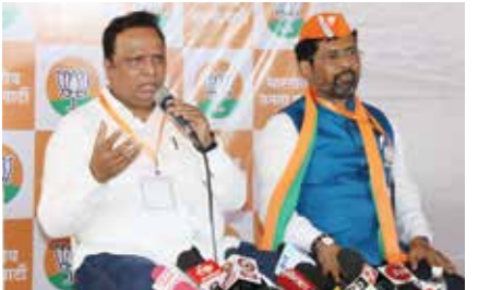
भाजप प्रदेश कार्यसमितीमध्ये विविध प्रस्ताव आणि ठराव

पनवेल : हिंदुत्ववादी बाळासाहेब ठाकरे यांचा हिंदुत्वाच्या विचारांचा वारसा घेऊन युतीतून जन्माला आलेल्या सरकारचे नेतृत्व करणाऱ्या मुख्यमंत्री एकनाथ शिंदे आणि पक्ष कार्यकर्त्यांना त्यागाचा आदर्श घालून देणाऱ्या उपमुख्यमंत्री देवेंद्र फडणवीस यांच्या अभिनंदनाचा प्रस्ताव शनिवारी भाजपच्या प्रदेश कार्यसमितीत मंजूर करण्यात आल्याची माहिती भाजप नेते आमदार अॅड. आशिष शेलार यांनी दिली. प्रदेश मुख् केशव उपाध्ये सोबत उपस्थित होते. प्रदेश कार्यसमिती बैठक पनवेलच्या आद्यक्रांतिवीर वासुदेव बळवंत फडके नाट्यगृहात