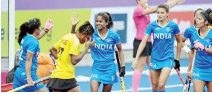
इंग्लंड, कॅनडा, वेल्स आणि घानासह भारत अ गटात आहे.

भारतीय महिला हॉकी संघ यंदाच्या राष्ट्रकुल क्रीडा स्पर्धेत १६ वर्षाचा पदकांचा दुष्काळ संपवण्याचे ध्येय ठेवून मैदानात उतरला आहे.