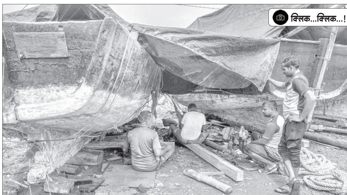
मुरुड : पावसाळ्यामुळे कोळी बांधवांनी आपल्या बोटी समुद्रकिनारी नांगरून ठेवल्या आहेत. नारळीपौर्णिमेच्या मुहुर्तावर बोटी पुन्हा समुद्रात मासेमारीसाठी जातील. त्यामुळे बोटी दुरुस्तीकडे कोळी बांधव आता वळले आहेत.

डॉ. जयंत नारळीकर यांनी सर फ्रेड हॉप्ले यांच्यासोबत कन्फॉर्मल ग्रॅव्हिटी थिअरी मांडली. चार दशकांहून अधिक कालावधीपासून त्यांचे खगोल भौतिकी क्षेत्रात संशोधन सुरु आहे. त्याचबरोबर सतत पुस्तके लिहिणे त्यांनी सुरुच ठेवले. सामान्य माणसाला खगोलशास्त्र समजावण्यासाठी त्यांनी गेली अनेक वर्षे प्रयत्न केले आहेत. त्यासाठी सर्व प्रसारमाध्यमांचा ते उपयोग करतात. त्यांच्या 'यक्षांची देणगी' या पहिल्याच पुस्तकाला महाराष्ट्र सरकारचा पुरस्कार मिळाला आहे. त्यांची विज्ञानकथा पुस्तके- 'अंतराळातील भस्मासूर', 'अंतराळातील स्फोट', 'अभयारण्य', 'चला जाऊ अवकाश सफरीला', 'टाइम मशिनची किमया', 'प्रेषित', 'यक्षांची देणगी', 'याला जीवन ऐसे नाव', 'वामन परत न आला', 'व्हायरस'. इतर विज्ञानविषयक पुस्तके- 'अंतराळ आणि विज्ञान', 'आकाशाशी जडले नाते' आदी आहेत.