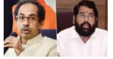
पक्षांच्या बाजू ऐकून घेतल्यानंतर पुढील बुधवारपर्यंत प्रतिज्ञापत्र सादर करण्याचे आदेश न्यायालयाने दिले, तर पुढील सुनावणी १ ऑगस्ट रोजी होईल, असे स्पष्ट केले.

सर्वोच्च न्यायालयात दाखल करण्यात आलेल्या याचिकेसंदर्भात सरन्यायाधीश एन. व्ही. रमण, न्यायमूर्ती कृष्ण मुरारी आणि न्यायमूर्ती हिमा कोहली यांच्या त्रिसदस्यीय पीठापुढे सुनावणी झाली. शिंदे गटाची बाजू ज्येष्ठ वकील हरिश साळवे यांनी मांडली, तर उद्धव ठाकरे गटाच्या वतीने ज्येष्ठ वकील कपिल सिब्बल आणि अभिषेक मनु सिंघवी यांनी युक्तिवाद केला. या वेळी दोन्ही