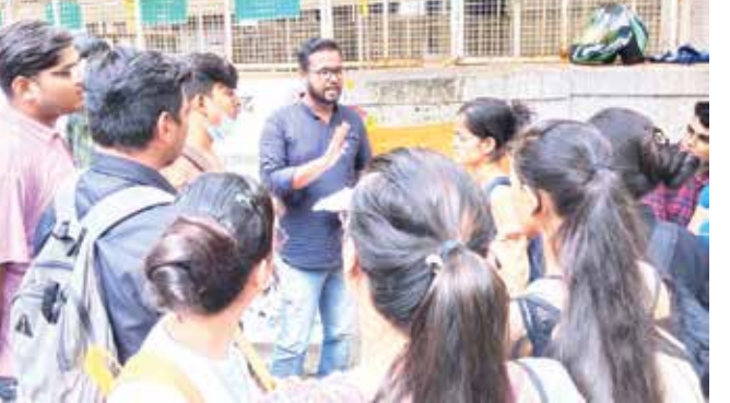
वर्षांपासून रिनोवेशनचे काम सुद्धा अपूर्णवस्थेत आहे. विद्यार्थ्यांना सामना कराव्या लागणाऱ्या अशा कित्येक समस्या व आय.सी.एल महाविद्यालय प्रशासनाकडून होत असलेल्या गैरकारभाराविरोधात सोमवारी (दि. १) अखिल भारतीय विद्यार्थी परिषद नवी मुंबई जिल्ह्याच्या वतीने महाविद्यालयाबाहेर स्वाक्षरी अभियान राबविण्यात आले.

अभाव पाहायला मिळत आहे. ८०० विद्यार्थ्यांना नाममात्र ४०० संगणकावरून शिक्षण दिले जात आहे. विद्यापीठ विकास निधी आणि डेव्हलपमेंट फंड या वेगवेगळ्या नावाने विद्यार्थ्यांकडून दरवर्षी ११०० रुपयांची वतीने स्वाक्षरी केली जाते. एनसीसी युनिटसाठी विद्यार्थी सातत्याने मागणी करत असतानाही मॅनेजमेंटचा या मागणीकडे कानाडोळा केला जात नाही. महाविद्यालयात अनुदानित प्राध्यापकांच्या २० जागा अजूनही त्या अध्यापक आहेत. विद्यापीठ परिषदनुसार गरजू विद्यार्थ्यांना इंस्टॅलमेंटची सुविधा बंधनकारक असतानाही ती महाविद्यालयात उपलब्ध केली जात नाही. गेल्या सहा ते सात वर्षांपासून उपहारगृह सुविधा दिली जात नाही. महाविद्यालयाच्या गलथान कारभारामुळे गेल्या सहा ते सात वर्षांपासून रिनोवेशनचे काम सुद्धा अपूर्णवस्थेत आहे. विद्यार्थ्यांना सामना कराव्या लागणाऱ्या अशा कित्येक समस्या व आय.सी.एल महाविद्यालय प्रशासनाकडून होत असलेल्या गैरकारभाराविरोधात सोमवारी (दि. १) अखिल भारतीय विद्यार्थी परिषद नवी मुंबई जिल्ह्याच्या वतीने महाविद्यालयाबाहेर स्वाक्षरी अभियान राबविण्यात आले. विद्यार्थ्यांच्या