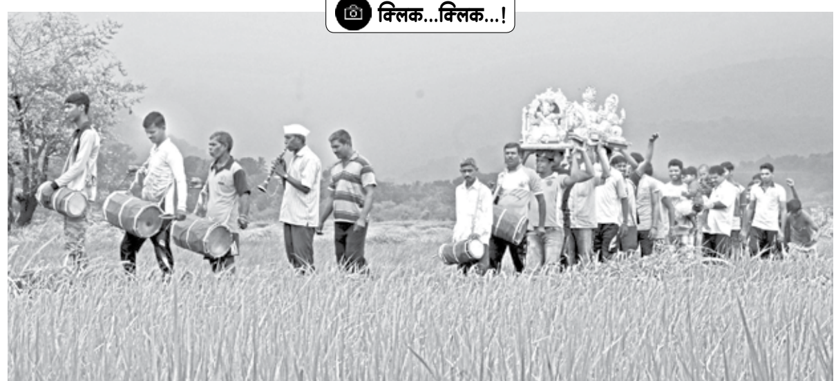
मुरुड : सर्वांच्या आवडत्या गणेशोत्सवास बुधवारपासून प्रारंभ झाला असून ग्रामीण भागात शेतातून वाट काढत गणरायाला वाजत-गाजत आपल्या घरी घेऊन जाताना भक्तगण.

कुलाबा वेधशाळा करीत असे. भारतीय प्रमाणवेळ ठरवणारे रेखावृत्त उत्तरप्रदेश, मध्यप्रदेश, आंध्रप्रदेश, ओडिशा व छत्तीसगड या राज्यांतून जाते. पुण्यात सूर्य मावळला तरी तत्क्षणी तो मुंबईत मावळलेला नसतो. पुण्यात सूर्य मावळल्यानंतर मुंबईत तो