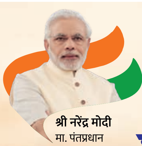
श्री नरेंद्र मोदी मा. पंतप्रधान