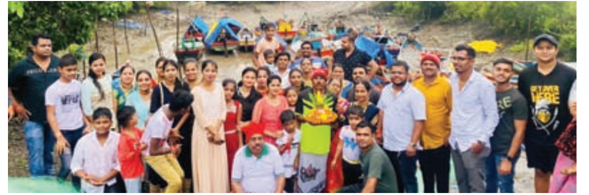
पनवेल : मोरावे येथे कोळी बांधवांनी पारंपरिक पद्धतीने नारळी पोंगिमा मोठ्या उत्साहात साजरी केली.