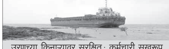
उरणच्या किनाऱ्यावर सुरक्षित; कर्मचारी सुखरूप