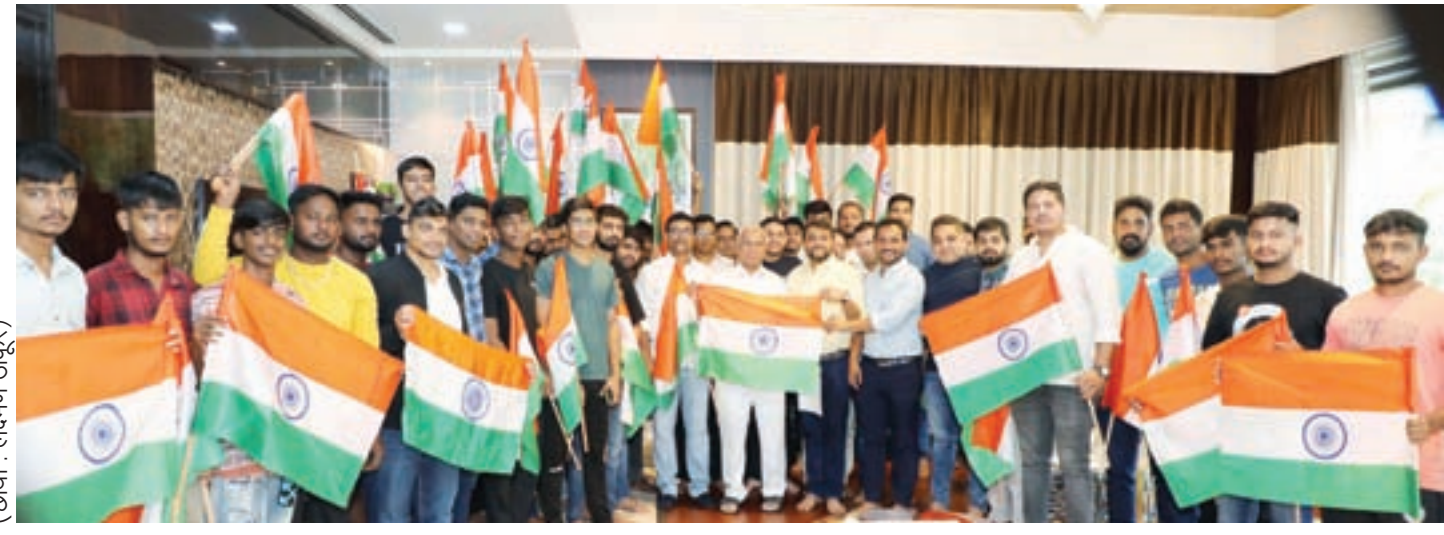
(छपा : लक्ष्मण ठाकूर)