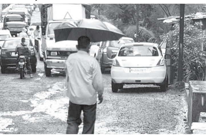
न्यायालयीन कामकाजासाठी या ठिकाणी आणि चारचाकी वाहन उभी करतात बाहेर गावाहून अनेक नागरिक येतात. त्यामुळे खालापूर गावातील नागरिक व ते याच रस्त्याकडेला आपली दुचाकी विद्यार्थ्यांना या ठिकाणावरून जा-ये

खालापूर गावाकडे जाणाऱ्या मुख्य रस्त्यालागत दिवाणी न्यायालय आहे.