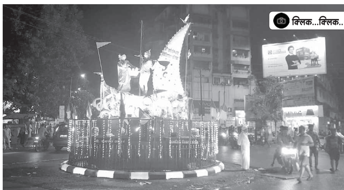
पनवेल : कोळी बंधू-भगिनींचा नारळीपौर्णिमा सण गुरुवारी मोठ्या उत्साहात साजरा झाला. यानिमित्त शहरातील उरण रोड येथील कोळेश्वर चौकाला आकर्षक रोषणाई करण्यात आली होती. हौशी लोक या ठिकाणी थांबून फोटो, सेल्फी घेत होते.