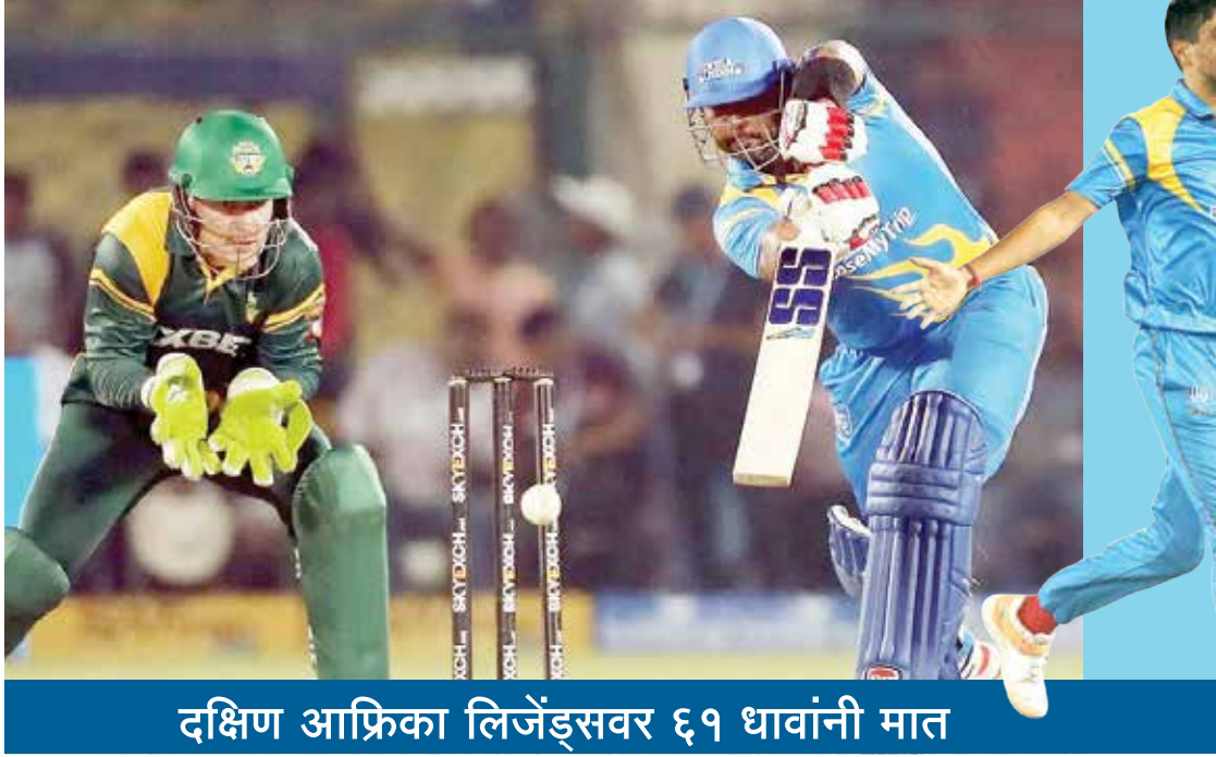
दक्षिण आफ्रिका लिजेंड्सवर ६१ धावांनी मात