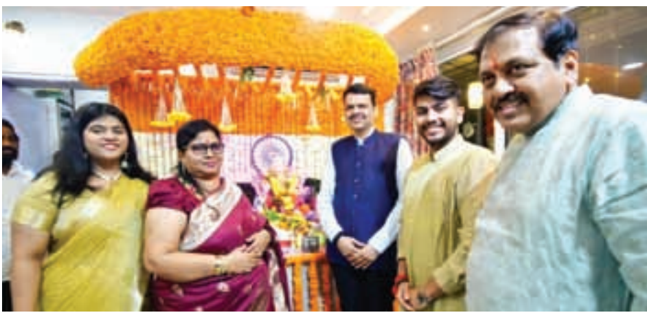
महाराष्ट्र भाजप कार्यालयीन मंत्री मुकुंद कुलकर्णी यांच्या निवासस्थानी उपमुख्यमंत्री देवेंद्र फडणवीस यांनी गणरायाचे दर्शन घेतले.