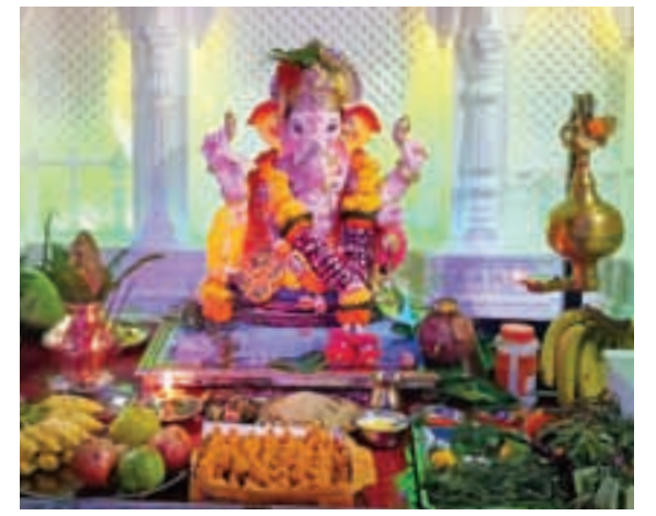
अरुण नामदेव कोळी, गव्हाण