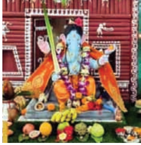
गव्हाणचे उपसरपंच विजय घरत, कोपर, पनवेल