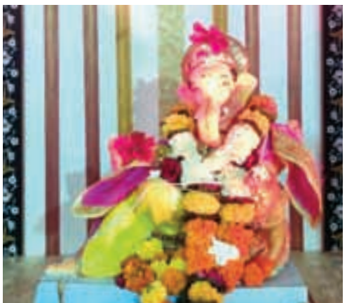
गोमुखी आळी सार्वजनिक गणेशोत्सव मंडळ, महाड