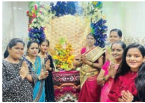
भाजप जासई विभाग महिला अध्यक्ष विश्रांती घरत, चिरनेर, उरण