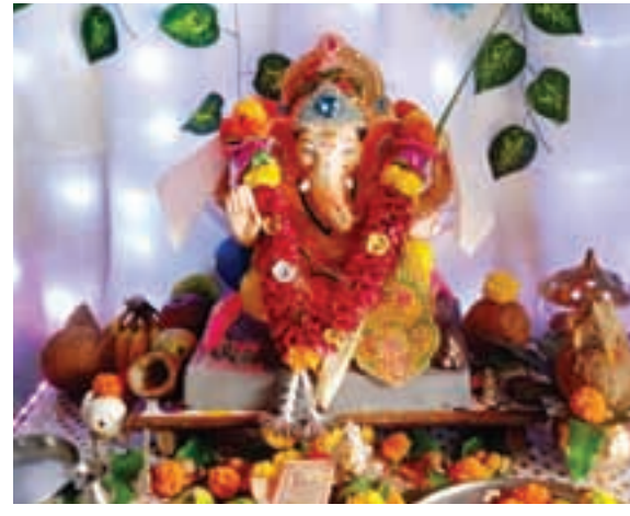
हरिभाऊ देशमुख, पनवेल