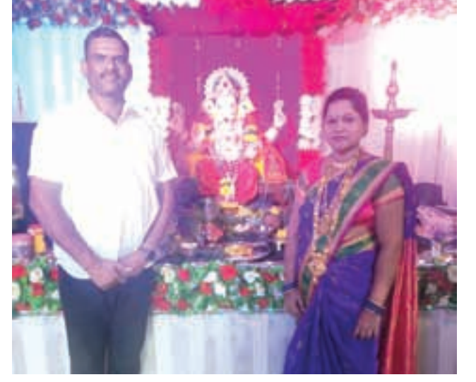
निसर्गा रोशन डाकी, विंधणे, उरण