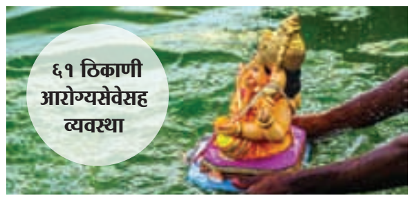
६१ ठिकाणी आरोग्यसेवेसह व्यवस्था

मंडप, जनरेटर, हॅलोजन, स्टेज, बॅरिगेट्स, क्रेन, हायड्रा, निर्माल्य कलश, लाऊड स्पीकर, लाईफ जॅकेट ठेवण्यात आले आहेत. घनकचरा आणि आरोग्य विभागांतर्गत घाटावर निर्माल्य कलश ठेवण्याची व्यवस्था करण्यात आली आहे. यासाठी पालिकेच्या कर्मचाऱ्यांच्या नियुक्त्या केल्या आहेत. गणेश विसर्जनावेळी त्या त्या ठिकाणी पथके तैनात करण्यात येणार असून एका अधिकाऱ्याबरोबर सफाई कामगार, स्वच्छता निरीक्षक, प्रभावी स्वच्छता परीक्षक, मुकादम अशी एक टीम