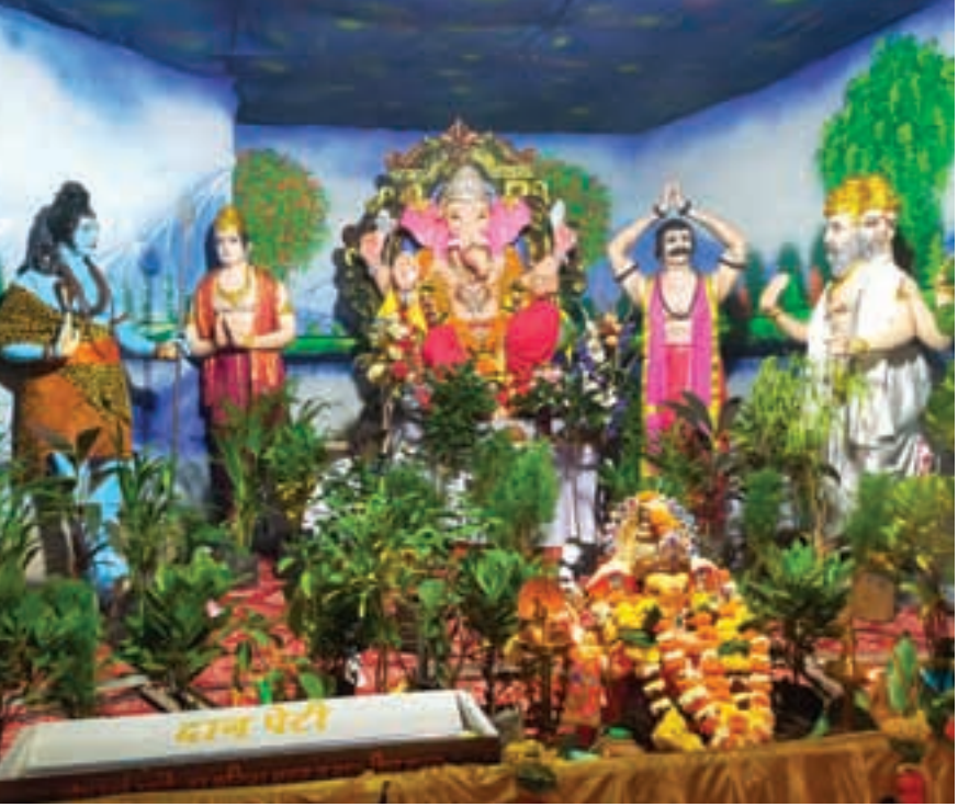
खांदा कॉलनी : ओम साई खांदेश्वर महिला व बाल मित्र मंडळाचा गणपती बाप्पा.

नवी दिल्ली : पंतप्रधान नरेंद्र मोदी यांच्या हस्ते गुरुवारी (दि. ८) संध्याकाळी सेंट्रल विस्टा अन्वयेनू अर्थात कर्तव्यपथचे उद्घाटन करण्यात आले. या प्रकल्पांतर्गत राष्ट्रपती भवन ते इंडिया गेट या मार्गाचे सुशोभिकरण करण्यात आले आहे. या कार्यक्रमादरम्यान पंतप्रधान नरेंद्र मोदींनी नेताजी सुभाषचंद्र बोस यांच्या पुतळ्याचेही अनावरण केले. दरम्यान, केंद्र सरकारकडून पुढील चार दिवस सांस्कृतिक कार्यक्रमांचे आयोजन करण्यात आले आहे. नव्याने उभारण्यात आलेला कर्तव्य पथ हा हिरवाईने नटलेला आहे. १६.५ किलोमीटरचा हा रस्ता लाल ग्रेनाईटने बनलेला आहे. या मार्गावर सुशोभित कालवे, अत्याधुनिक सार्वजनिक सुविधा, विविध राज्यांची खाद्यसंस्कृती दर्शवणारी १६ दुकाने उभारण्यात आली आहेत.