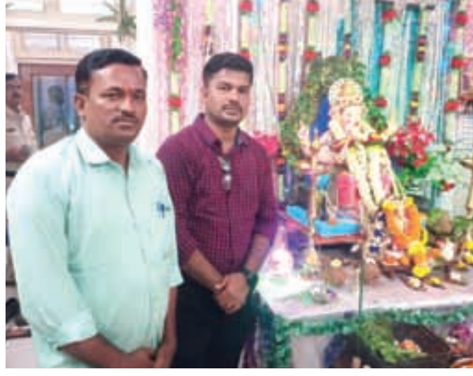
पनवेल तालुका पोलीस ठाणे