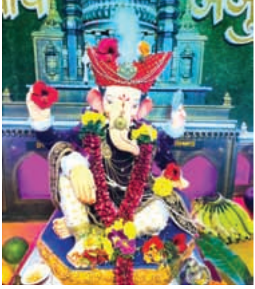
अभिजित घरत, बेलपाडा, उरण