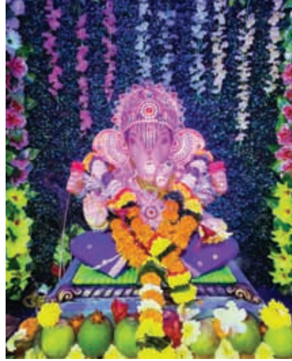
स्वरांश घरत, खारपाडा, पेण