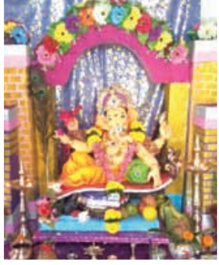
दौलत भोईर, आवरे, उरण