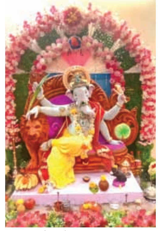
गणेश तांडेल, उरण चारफाटा