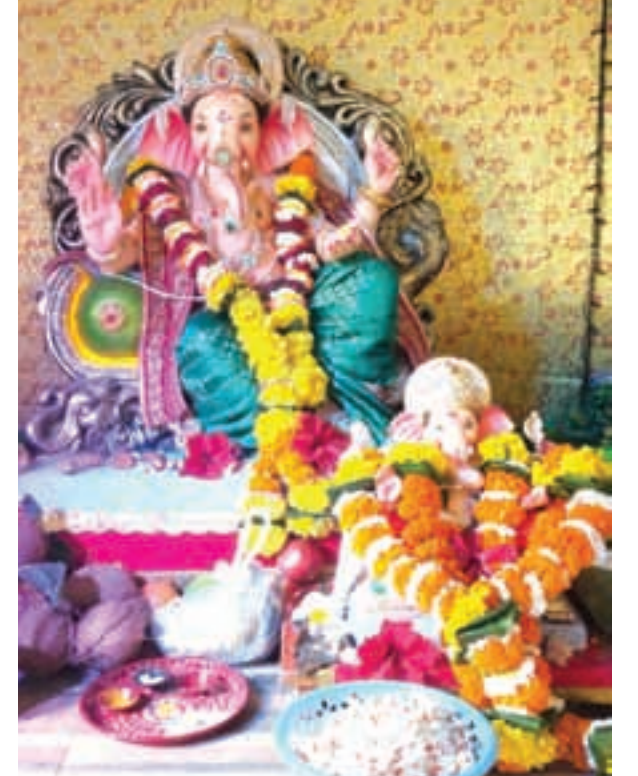
एकनाथ घरत, चिंचवन, पनवेल