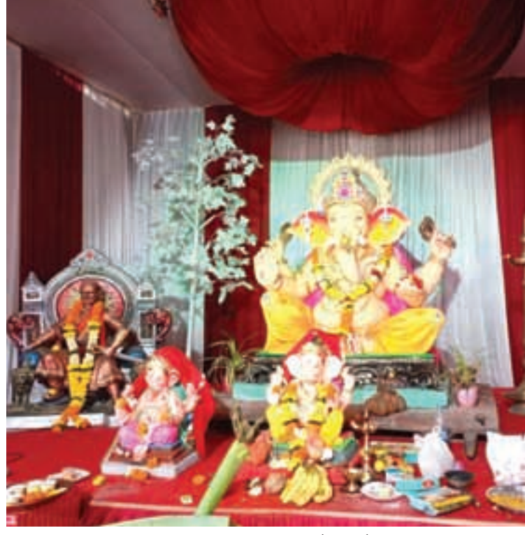
एकता मित्र मंडळ, करंजाडे, पनवेल