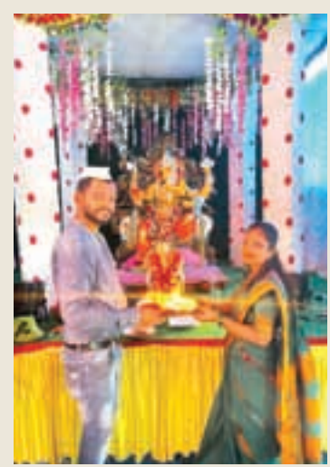
तरुण उत्साही मित्र मंडळ, वर्ष १२ वे, पळसपे, पनवेल