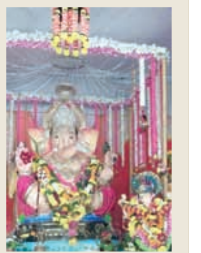
सिद्धेश्वर सेवा भावी युवा मंडळ, दिघोडे, उरण