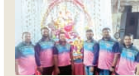
विघ्नहर्ता गणेश मित्रमंडळ, गोवठणे, उरण

अनंत चतुर्दशीनंतर साखरचौथीच्या म्हणजेच गौरा गणपतीचे आगमन झाले आहे. सार्वजनिक व घरोघरी स्वरूपात हा बाप्पा विराजमान करून त्याची सेवा केली जाते. या गणेशोत्सवाची चित्रमय झलक.