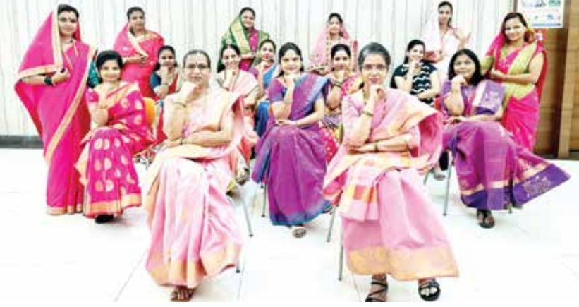
नवी मुंबई महापालिकेच्या बेलापूर मुख्यालयातील आरोग्य विभाग कर्मचारी