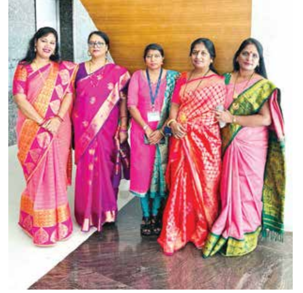
नवी मुंबई महापालिकेच्या बेलापूरमधील मुख्यालयातील कर्मचारी