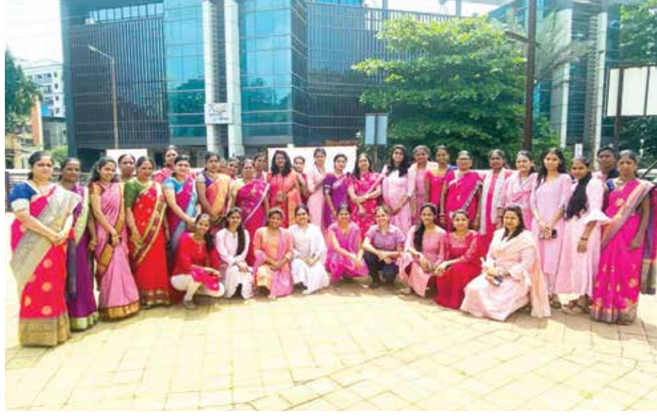
पनवेल महापालिका कर्मचारी