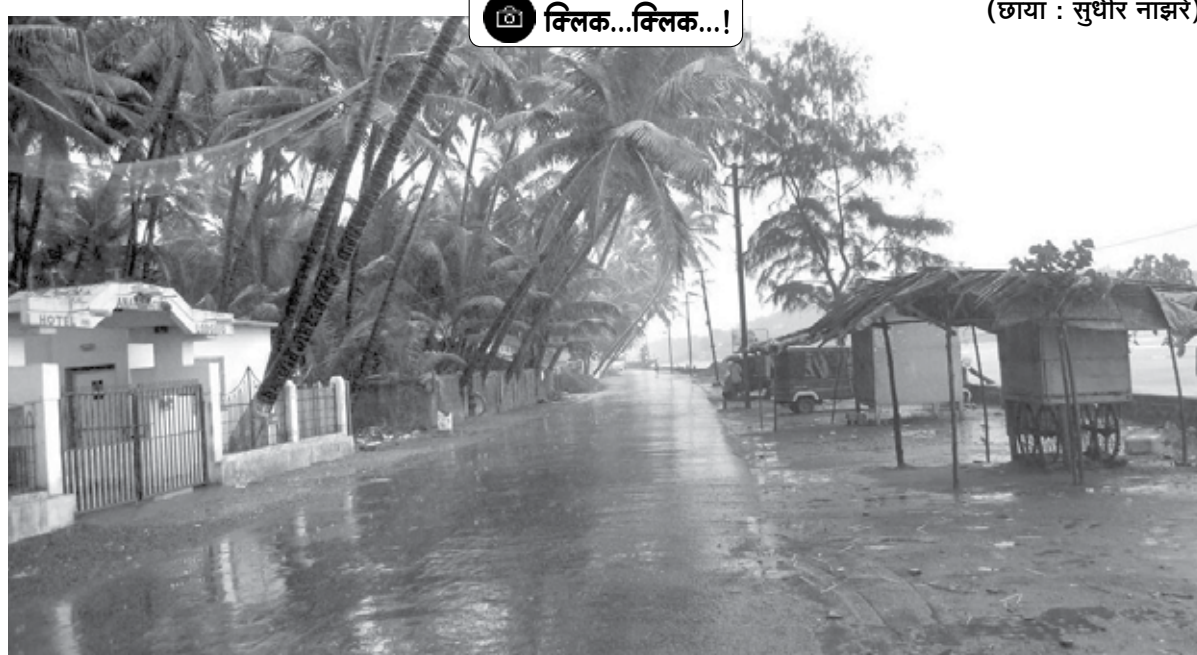
मुळूड : सध्या सुरु असलेल्या परतीच्या पावसामुळे पर्यटक येत नसल्याने किनारा परिसरात शुक्रशुक्रात पसरला आहे.

२०११ च्या आयपीएलच्या लिलावात गंभीरला सर्वाधिक पसंती देण्यात आली होती. त्याने कोलकाता नाईट रायडर्सकडून २.४ दशलक्ष डॉलर्सची बोली लावली आणि आयपीएलच्या इतिहासातील सर्वाधिक मानधन घेणारा क्रिकेटपटू ठरला. त्यानंतर त्याला संघाचा कर्णधार म्हणून नेमण्यात आले. गंभीरच्या नेतृत्वात कोलकाता नाईट रायडर्सने आयपीएलच्या प्लेऑफसाठी पात्रता मिळविली आणि चॅम्पियन्स लीग ट्वेंटी-२०मध्ये प्रथमच प्रवेश केला. अखेरीस त्याने चेन्नईच्या घरच्या मैदानावर चेन्नई सुपर किंग्जचा ५ गडी राखून पराभव करून चॅम्पियन्सला पहिले जेतेपद मिळवून दिले. गंभीर कोलकाता नाईट रायडर्सचा अग्रगण्य धावा करणारा खेळाडू आहे. त्याच मोसमात त्याने आपल्या संघाकडून एकूण नऊपैकी सहा अर्धशतके झळकावली आणि २००० धावांचा टप्पा पार करून स्पर्धेतील दुसऱ्या क्रमांकाची नोंद करणारा आयपीएल इतिहासातील दुसरा खेळाडू ठरला.