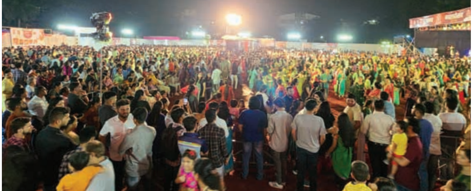
अधिक छायाचित्रे पान ८ वर..

मुंबई : शिवसेनेच्या ठाकरे गटाला मुंबईच्या वरळीत मोठा धक्का बसला आहे. वरळीतील शेकडो शिवसैनिकांनी मुख्यमंत्री एकनाथ शिंदे यांचे शासकीय निवासस्थान 'वर्षा'वर शिंदे गटात प्रवेश केला आहे. कार्यकर्त्यांचा हा प्रवेश युवासेनाप्रमुख आमदार आदित्य ठाकरेंना मोठा धक्का मानला जात आहे. दसरा मेळाव्याच्या काही दिवसांआधीच वरळीतील कार्यकर्त्यांनी ठाकरे गटाची साथ सोडली आहे. आदित्य ठाकरे वरळी विधानसभा मतदारसंघाचे आमदार आहेत. बालेकिल्ल्यातच शिवसैनिकांनी साथ सोडल्यानंतर आदित्य यांची पुढील वाटचाल कठीण मानली आहे.