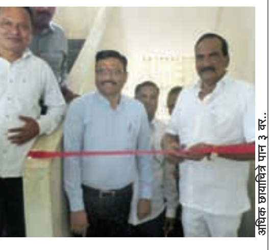
अधिक छायाचित्रे पान ३ वर..