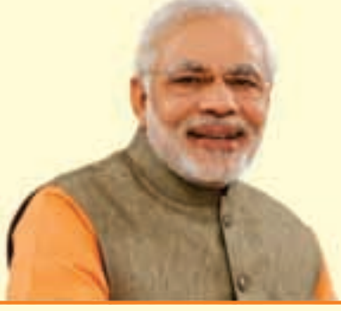
श्री. नरेंद्र मोदी मा. पंतप्रधान

विंडीज वर्ल्डकपमधून 'आऊट'; आयर्लंडचा मोठा विजय/८