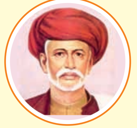
महात्मा जोतिराव फुले