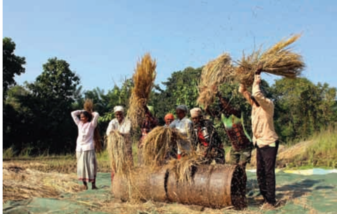
पनवेल : वरुणराजाने निरोप घेतल्याने दिवाळीनंतर शेतीकामांना वेग आला आहे. शिवारात पिकविलेल्या भातपिकाची झोडणी करण्यात शेतकरीवर्ग सध्या गर्क आहे.

पुढच्या महिन्यात ई-बसन्तर ई-ट्रक लॉन्च करणार असल्याची माहिती या वेळी ना. गडकरी यांनी दिली तसेच मला पेट्रोल-डिझेलला हद्दपार करायचे आहे, असेही त्यांनी स्पष्ट केले. आयआयटीसमोर मेट्रोचे काम सुरू आहे. मेट्रो, ब्रिजमधील दोन पिलरमध्ये आपल्याकडे ३० मीटर अंतर आहे, तर मलेशियामध्ये १०२ मीटर आहे. फायबर स्टीलचा वापर तिथे केला जातो, ज्यामुळे कॉस्ट कमी होते. हा तंत्रज्ञानाचा वापर आपण केला पाहिजे, असे आवाहन ना. गडकरींनी केले.