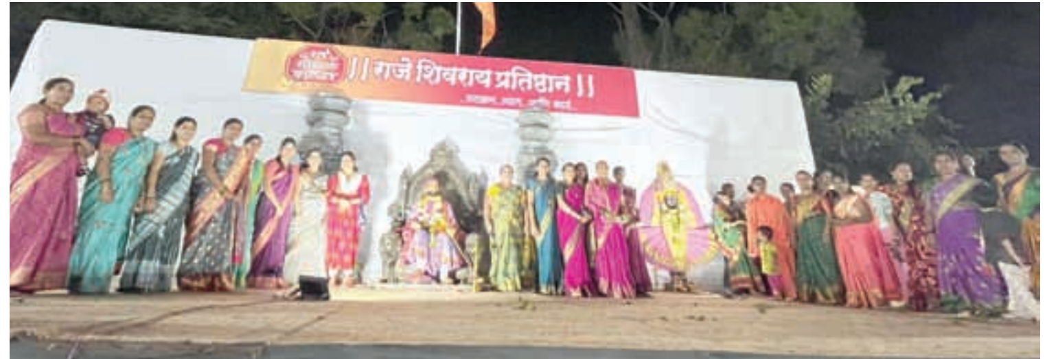
पनवेल : राजे शिवराय प्रतिष्ठानच्या वतीने नवीन पनवेल येथे सिंधुदुर्ग किल्ल्याची भव्य प्रतिकृती साकारण्यात आली आहे. या ठिकाणी स्त्रीशक्ती संघटनेच्या कार्यक्रमाद्वारे महिलांना एकत्र करून त्यांच्या हस्ते देवीची ओटी भरण्यात आली. या वेळी महिलांनी एकमेकीला हळद-कुंकू लावून आगामी काळातही विधायक कार्यासाठी एकवटण्याचा निर्धार केला.