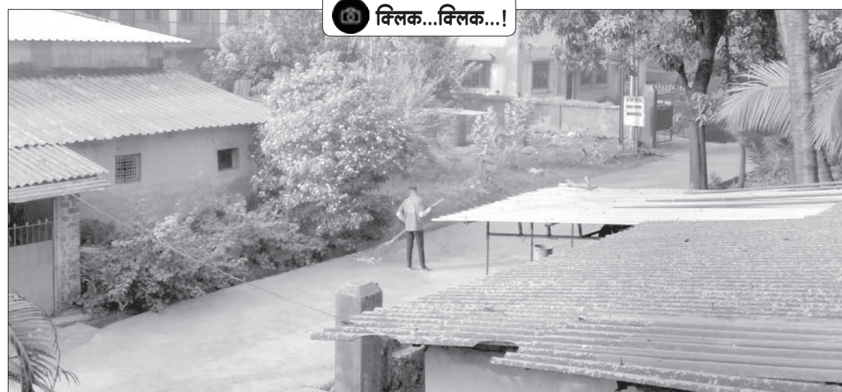
पनवेल : महापालिकेच्या माध्यमातून पालिका हद्दीतील गावागावात सातत्याने स्वच्छता राखली जाते. हे दृश्य आहे धरणा कॅम्प गावातील सकाळच्या वेळेत पालिका स्वच्छतादूत मन लावून गावात सफाई करत असतानाचे.