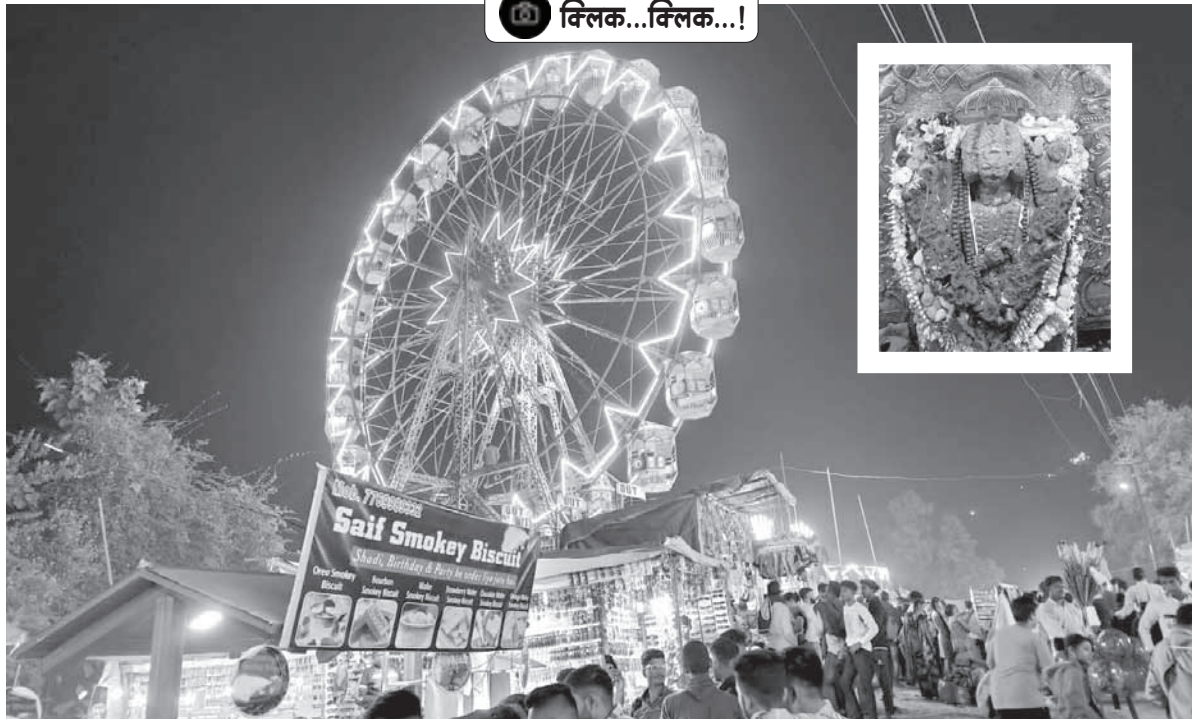
अलिबाग : कोरोनाच्या दोन वर्षांनंतर यंदा चोल भोवाळे येथे श्री दत्त जयंतीनमित्त यात्रा भरली आहे. (छाया : हर्षल मोरे)