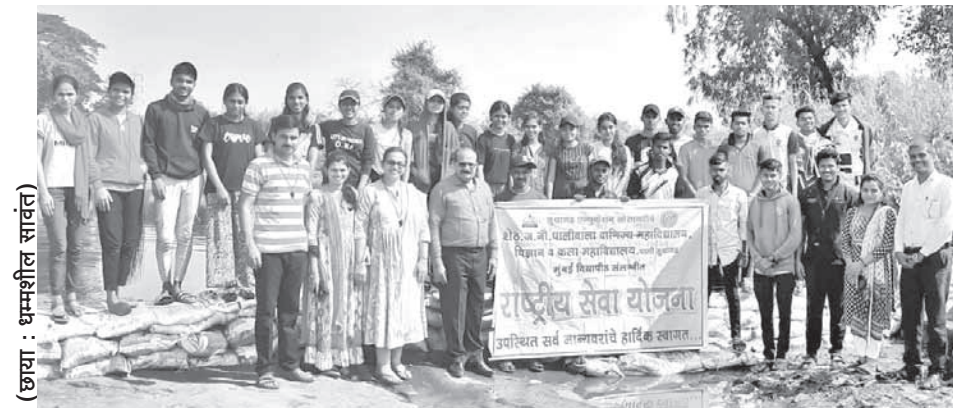
सुधागडात श्रमसंस्कार शिबिरातून विद्यार्थ्यांनी गावचे रूप पालटले