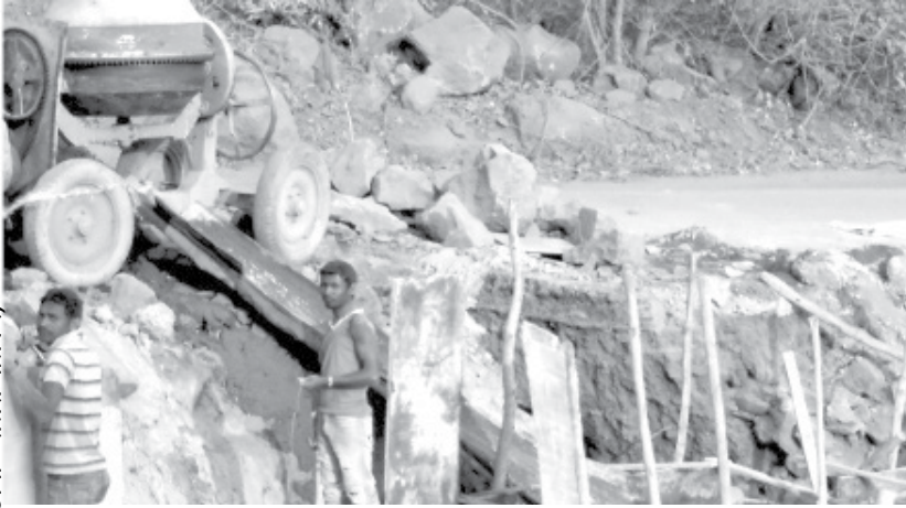
चित्र : शैलेश घाटकरी

सद्यस्थितीत पारफाटचापासून महाबळेश्वरलागतच्या मेटलचे गावापर्यंतच्या घाटरस्त्यातील मोऱ्यांच्या कामात रस्ता फोडून काँक्रीटचे पाईप जमिनीमध्ये गाडण्याचे