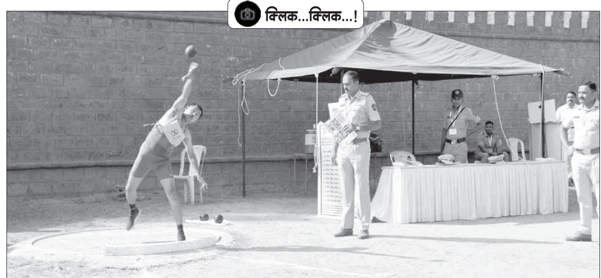
अलिबाग : रायगड पोलीस दलातील शिपाई आणि चालकपदाच्या भरतीची प्रक्रिया मंगळवारपासून सुरू झाली. पहिल्या दिवशी चालकपदासाठी पुरुष व महिला उमेदवारांची कागदपत्रे पडताळणी व मैदानी चाचणी घेण्यात आली.