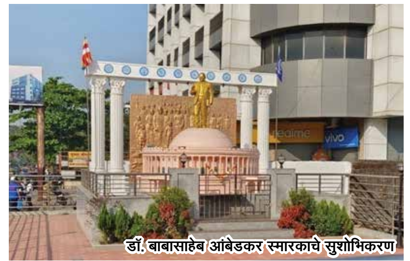
डॉ. बाबासाहेब आंबेडकर स्मारकाचे सुशोभीकरण

भारताचे संविधान नऊ - क - नगरपालिका अनुच्छेद २४३ भ अन्वये मालमत्ता कर आकारणी करणे, वसूल व विनियोजन करणेकामी तरतूद केलेली आहे. महाराष्ट्र महानगरपालिका अधिनियम कलम १२७, १२८, १२९, १५० अ अंतर्गत मालमत्ता कराची आकारणी करणेत येत आहे. महाराष्ट्र महानगरपालिका अधिनियम परिशिष्टे चार कलम ४९३ संक्रमण कालीन तरतूदी ५ (ब) अन्वये मालमत्ता कर आकारणी करण्यात येत आहे.