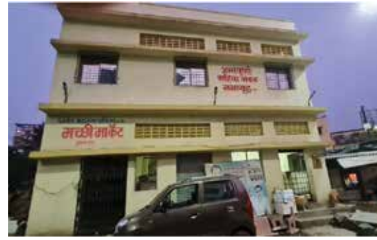
मिथमार्केट इमारत नावडे