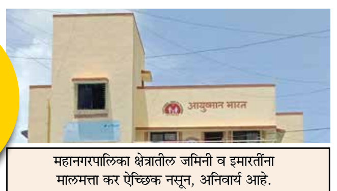
महानगरपालिका क्षेत्रातील जमिनी व इमारतींना मालमत्ता कर ऐच्छिक नसून, अनिवार्य आहे.

थकीत मागणी वर ०१ एप्रिल पासून प्रती माह २% शास्ती / दंड लागतो, बिल दिल्यापासून संपल्यानंतर ९० दिवसाच्या आत भरणा न केल्यास अर्धवार्षिक वर दरमहा २% शास्ती महा शिक्षण कर, रोजगार हमी कर, मोठी इमारत कर, घन कचरा कर सोडून इतर म.न.पा करावर लागते.