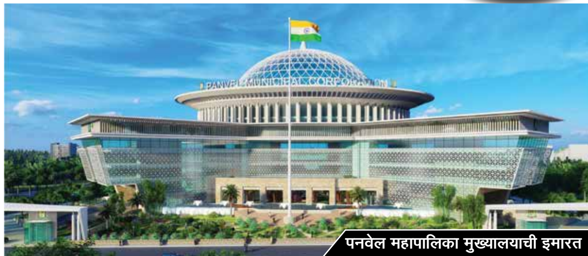
पनवेल महापालिका मुख्यालयाची इमारत