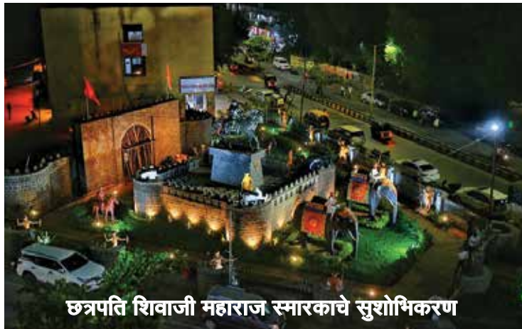
छत्रपति शिवाजी महाराज स्मारकाचे सुशोभीकरण

महाराष्ट्र महानगरपालिका अधिनियम कलम ३ अन्वये महापालिका स्थापनेपासून करआकारणी करणेत आली आहे व कलम १५० अ तसेच अनुसूची ड प्रकरण ८ क्राधान नियम १५(२) अन्वये पूर्वलक्षी प्रभावाने मागील ६ वर्षे पर्यंत मालमत्ता कर आकारणी करणेत आलेली आहे. महाराष्ट्र महानगरपालिका अधिनियम कलम ९९ व १२८ अ अन्वये स्थायी समिती सभा उराव क्रमांक १५-०१-२०१९ अन्वये मालमत्ता कर व दरास मंजूरी देण्यात आली. सादर मंजूरी सर्वसाधारण सभा उराव क्रमांक ११८ दिनांक १७-०१-२०१९ अन्वये मालमत्ता कर व करांचे दिनांक ०१-१०-२०१६ पासून मान्यता देण्यात आलेली आहे.