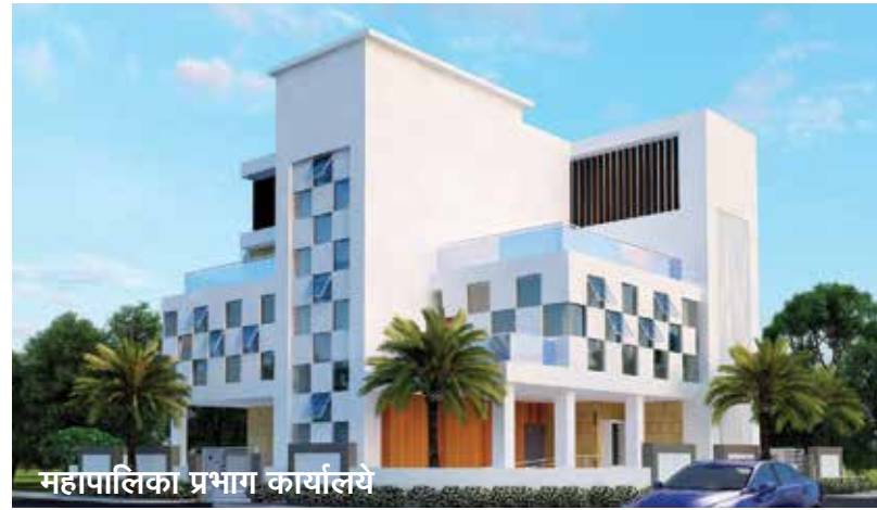
महापालिका प्रभाग कार्यालय

स्थानिक नगरपालिका संस्था काही महत्त्वाच्या सेवा पुरवतात, जसे की परिसरात स्वच्छता ठेवणे, पाणी पुरवठा, स्थानिक रस्त्यांची देखभाल, ड्रेनेज आणि इतर नागरी सुविधा. मालमत्ता कर महानगरपालिका संस्थांना ती प्रदान केलेल्या सर्व सेवांसाठी महसूल मिळवून देतो. महापालिका संस्थांच्या उत्पन्नाचे हे प्रमुख स्रोत आहे. जर तुम्ही मालमत्ता कर भरला नाही तर, नगरपालिका संस्था पाणी कनेक्शन किंवा इतर सेवा देण्यास नकार देऊ शकते आणि ती देय रक्कम वसूल करण्यासाठी कायदेशीर कारवाई देखील करू शकते.