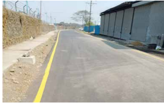
ग्रामीण भागातील रस्त्यांचे डांबरीकरण

व्हीआरपी सर्वेनुसार २६ झोपडपट्ट्यांचे झालेले सर्वेक्षण, सर्वेक्षण झालेल्या २६ झोपडपट्ट्यांपैकी शक्य असलेल्या झोपडपट्ट्यांचे पुनर्वसन करणे, तसेच शासनाच्या विविध समाज उपयोगी कल्याणकारी योजना महापालिका क्षेत्रात राबविण्याबाबत विचारविनिमय करण्यात आला असून पंतप्रधान आवास योजने अंतर्गत पहिल्या टप्प्यात झोपडपट्टी धारकांसाठी २४०० घरे बांधून देण्याचे उद्दिष्ट ठेवण्यात आले असून वाल्मिकीनगर, महाकालीनगर, लक्ष्मी वसाहत, कच्छी मोहल्ला आणि पटेल मोहल्ला अशा पाच ठिकाणी खऱ्या अर्थाने पनवेल शहराची झोपडपट्टी सुरु असून युद्ध पातळीवर पाठपुरावा सुरु असून शासकीय मंजूरी मिळाल्या मुक्त बघायला मिळणार