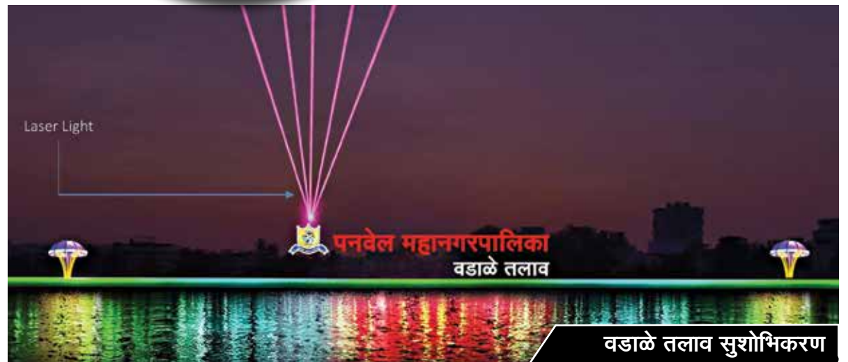
वडाळे तलाव सुशोभीकरण