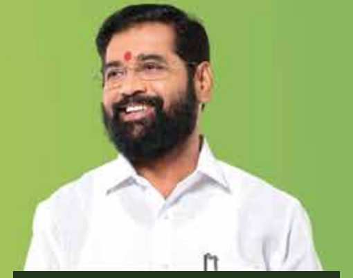
एकनाथ शिंदे मुख्यमंत्री