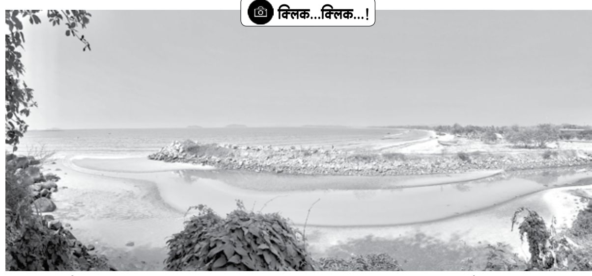
अलिबाग : नदीचा शांत प्रवाह उथळ समुद्राला जाऊन मिळत असतानाचा क्षण...