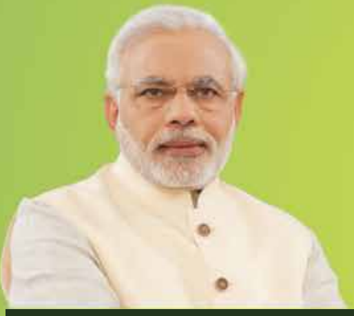
नरेंद्र मोदी प्रधानमंत्री

मैदान, नेहली येथील जिल्हा क्रीडा संकुल आणि महिला लेदर बॉल क्रिकेट स्पर्धा खानाव येथे होणार आहेत. सर्व सहभागी खेळाडूंना, शाळांना प्रशस्तीपत्र देण्यात येणार आहे, तर विजेत्या खेळाडूंना पदके देऊन सन्मानित करण्यात येणार आहे. स्पर्धा शालेय विद्यार्थ्यांसाठी असल्याने ज्या शाळेतील विद्यार्थी जास्त पदके मिळवतील त्या शाळेला स्पर्धा विजेतेपदाचा चषक देण्यात येईल.