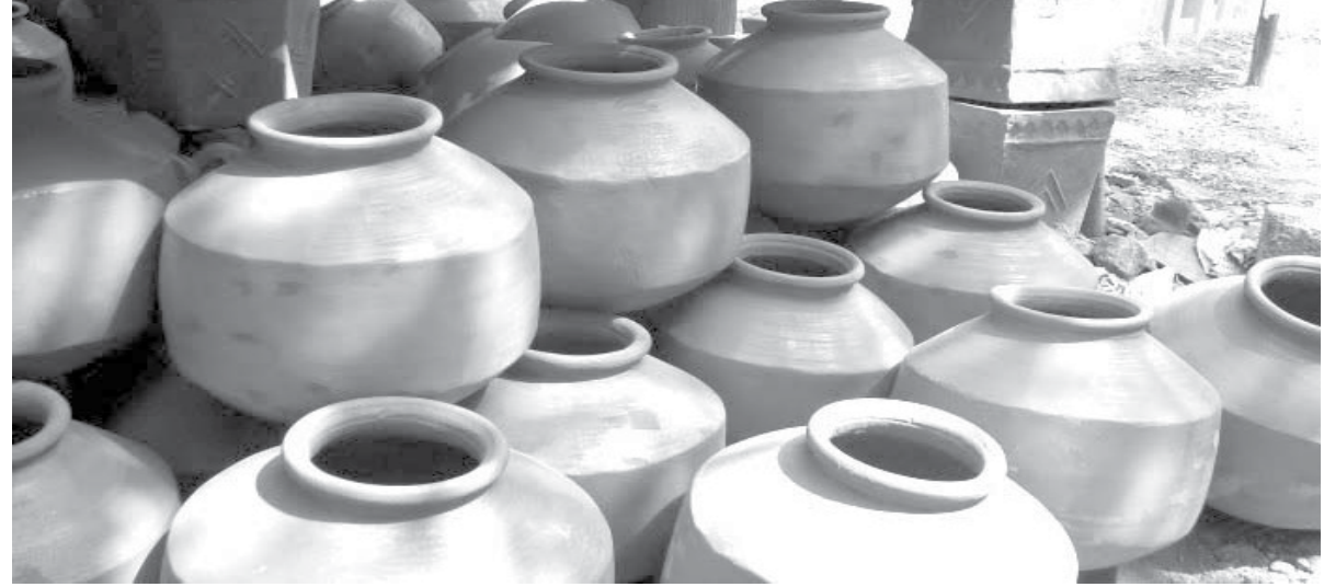
पनवेल : उन्हाची चाहूल लागताच गरीबांचा फ्रीज म्हणून ओळखला जाणारा माठ सध्या शहरात अनेक ठिकाणी विक्रीसाठी ठेवला आहे.