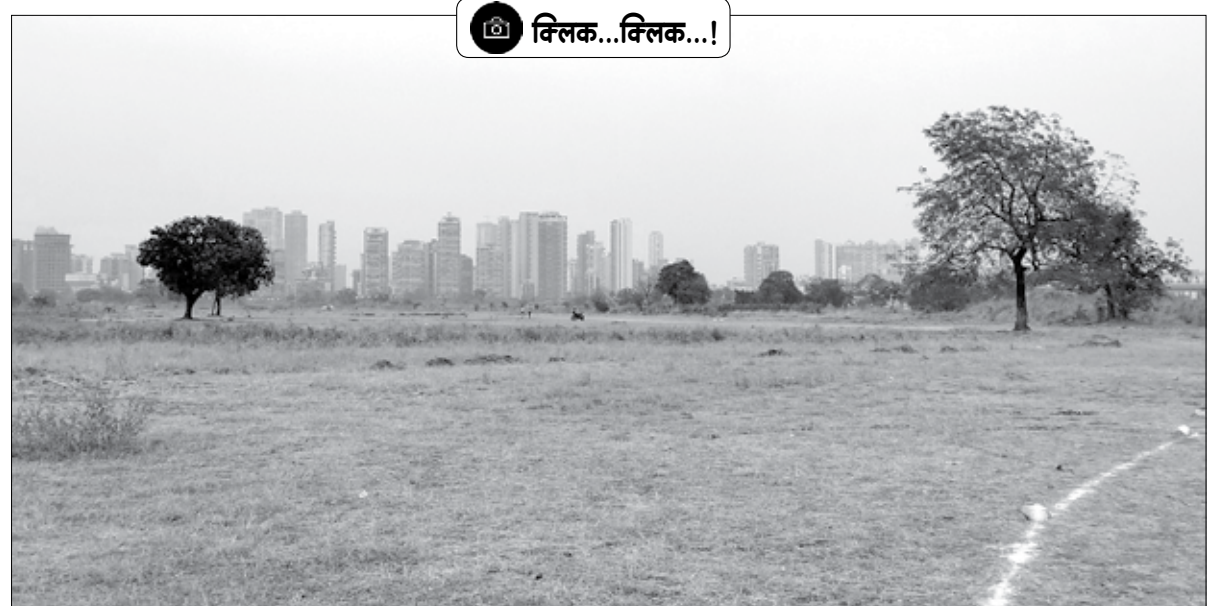
खारधर : कौंक्रिटीकरणाच्या जंगलात झाडेच दुर्मीळ होत असल्याचे वास्तव दर्शवणारे दृष्य.