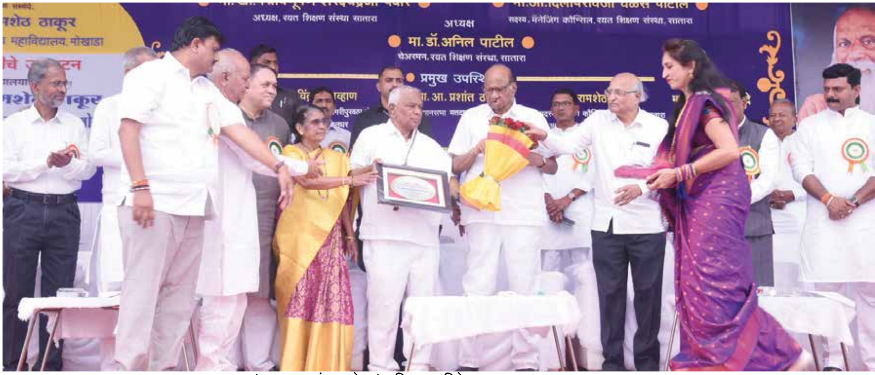
अधिक छायाचित्रे पान ८ वर..

संस्थेचे अध्यक्ष खासदार शरद पवार यांचे गौरवोद्गार