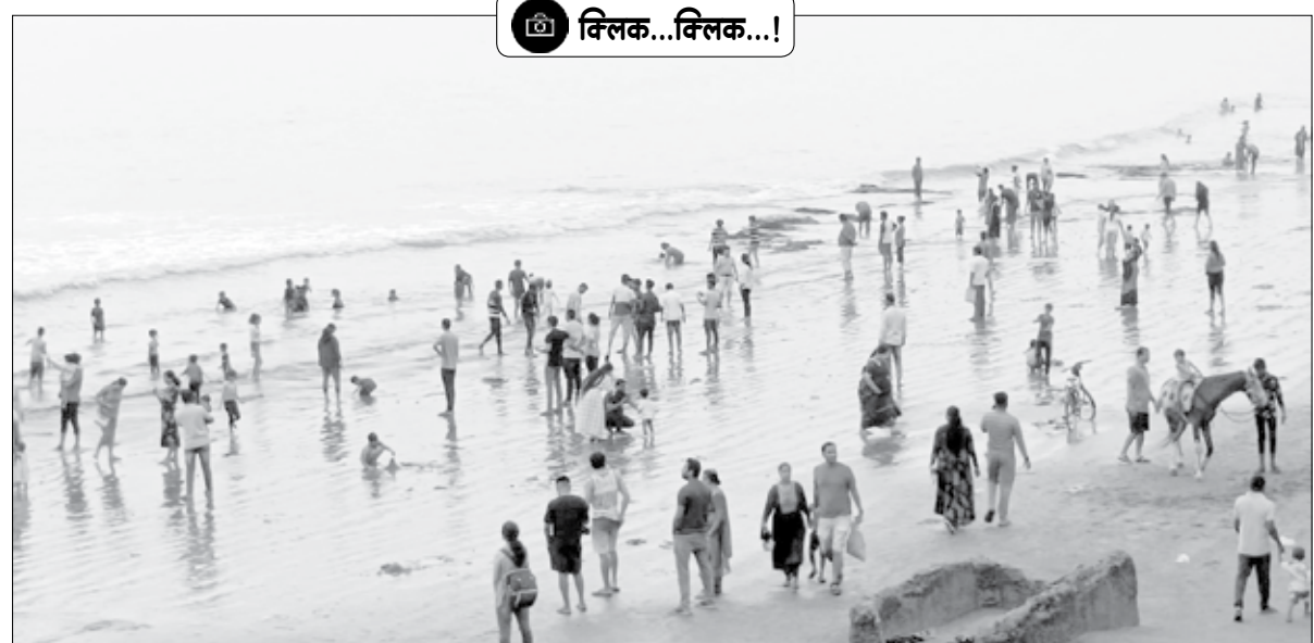
उरण : सध्या सर्वत्र शाळेला उन्हाळी सुट्ट्या असल्याने पीरवाडी बीचवर नागरिकांनी गर्दी केली होती.