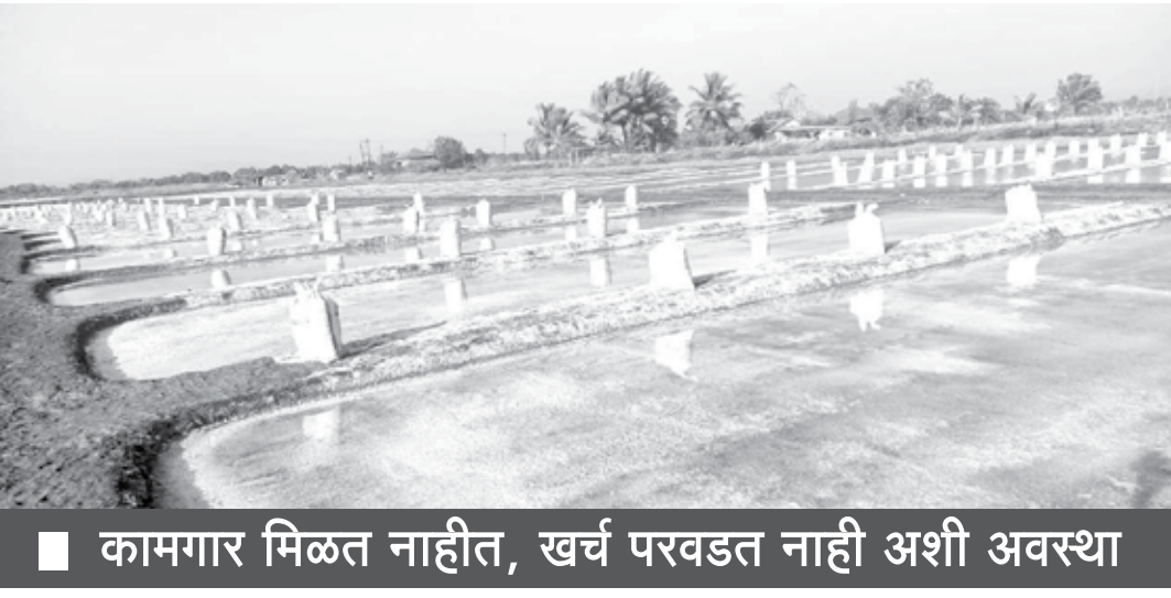
कामगार मिळत नाहीत, खर्च परवडत नाही अशी अवस्था

दहा ते बारा वर्षांपूर्वी जिल्ह्यात दरवर्षी ३० ते ३५ हजार टन मिठाचे उत्पादन घेतले जात होते. आता फक्त ते दीड हजार ते दोन हजार टनापर्यंत खाली आले आहे. रायगड जिल्ह्याची भाताचे कोठार ही ओळख जशी