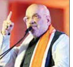
केंद्रीय गृहमंत्री अमित शाहांचा विश्वास

नवी दिल्ली : वृत्तसंस्था कर्नाटक विधानसभा निवडणुकीसाठी प्रचाराच्या तोफा सोमवारी (दि. ८) थंडावल्या. कर्नाटकात भाजप-काँग्रेसमध्ये थेट लढत आहे. अशात कर्नाटकात भाजपचे सरकार स्थापन होणार असल्याचा विश्वास केंद्रीय गृहमंत्री अमित शाह यांनी व्यक्त केला आहे. केंद्रीय गृहमंत्री शाह म्हणाले की, मी कर्नाटकातील सर्व भागांचा दौरा केला आहे. गेल्या निवडणुकीच्या तुलनेत यंदा सर्वच भागात भाजपचा वाढता प्रभाव आहे. लोकांचा उत्साह आणि मिळणारा पाठिंबा पाहता भाजप पूर्ण बहुमताने सरकार स्थापन करेल. काँग्रेसवर