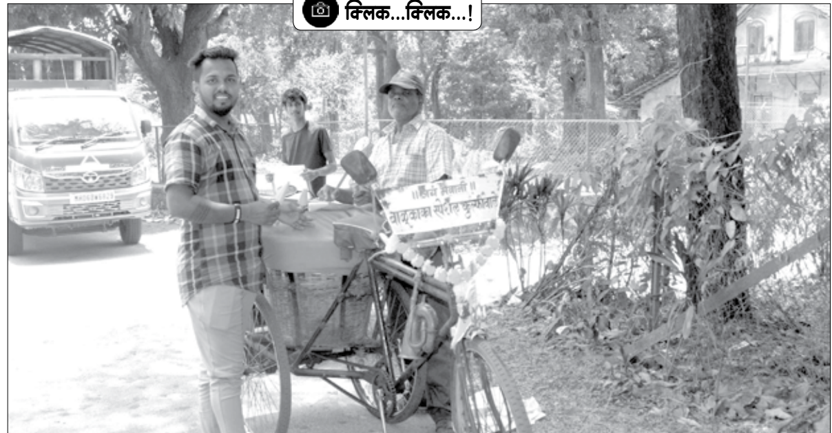
अलिबाग : सायकलच्या पोंग्यासह कुल्की.. कुल्की असा संमिश्र आवाज नागाव, हटाळे, आक्षी परिसरात गेली पंचवीस वर्षे परिचित आहे. थंडगार कुल्कीने ऐन उन्हाळ्यात घश्याला पडलेली कोरड घालविणारा नागावचा 'बाळूकाका स्पेशल मलई कुल्कीवाला' नागावमधील लहान-थोरांचा जणू कुटूंब सदस्य झाला आहे.