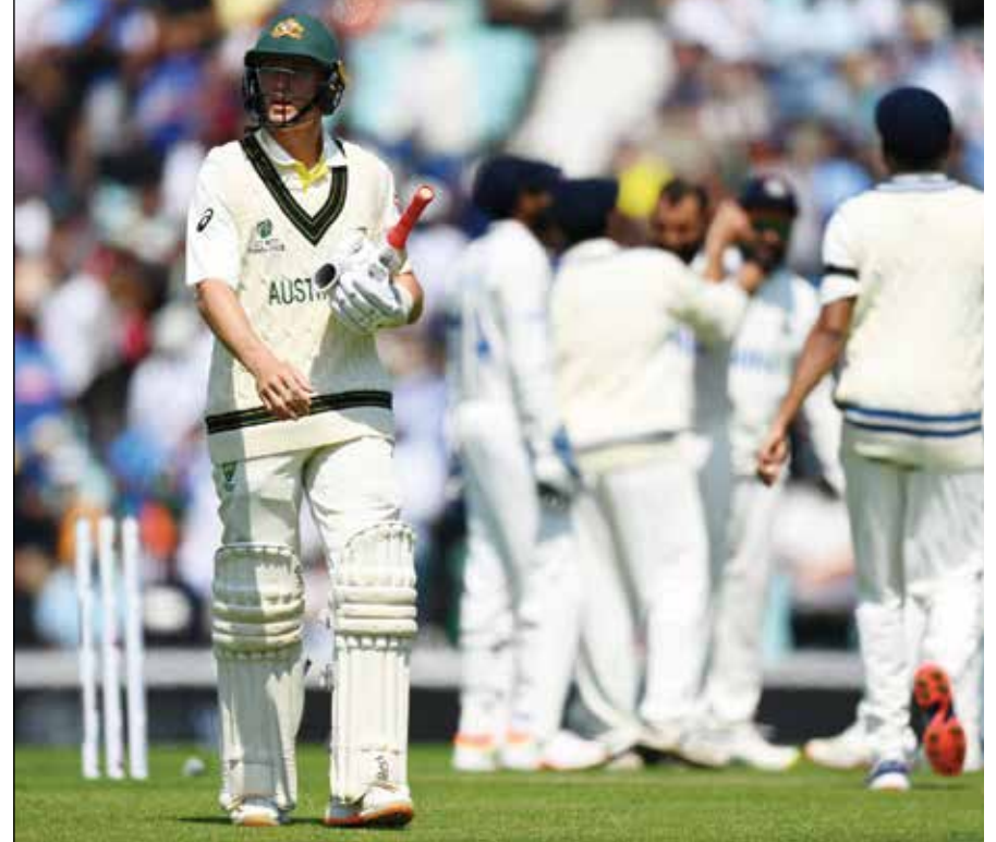
लंडन : जागतिक कसोटी अजिंक्यपद स्पर्धेच्या अंतिम सामन्यात पहिल्या दिवशी भारताच्या मोहम्मद शमीने ऑस्ट्रेलियाच्या मार्नस लाबूशेनला बाद केले. त्या वेळी टीम इंडियाने केलेला आनंद.